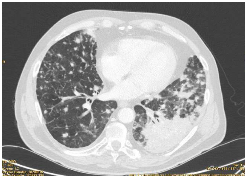
Imagen 2: Adenocarcinoma bronquiolo alveolar. Patrón retículo nodular grosero configurando nódulos de 15 mm de diámetro en ambos pulmones. Gran progresión respecto a la exploración previa.