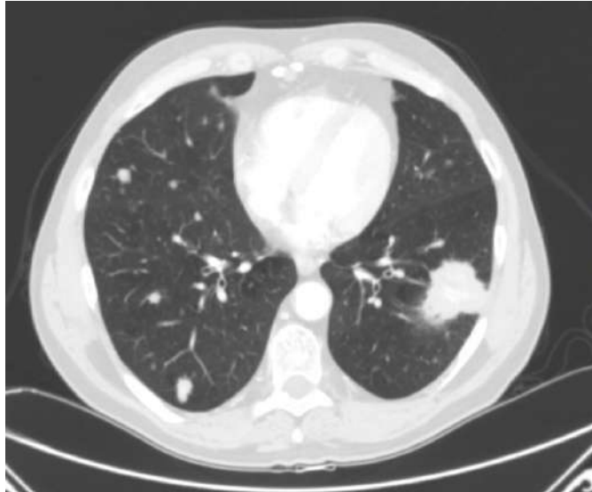
Imagen 1: TC de tórax de control de hipernefroma intervenido quirúrgicamente en el que se observa masa pulmonar localizado en LII, con contornos espiculados y conexión pleural, presentando unas dimensiones aproximadas de 37 mm de diámetro anteroposterior.