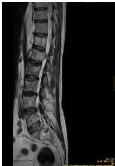
Imagen 3B: Afectación del conducto raquídeo a nivel de L1.