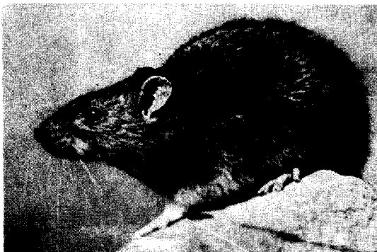
De bruine rat

Zij heeft onder meer een voorlichtende taak over de toepassing van rodenticiden (ter bestrijding van knaagdieren), insecticiden (id. insecten) en fungiciden (id. schimmels).