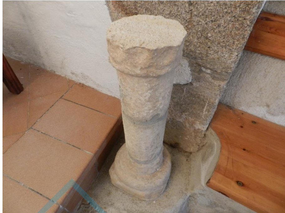
Fuste de columna románico