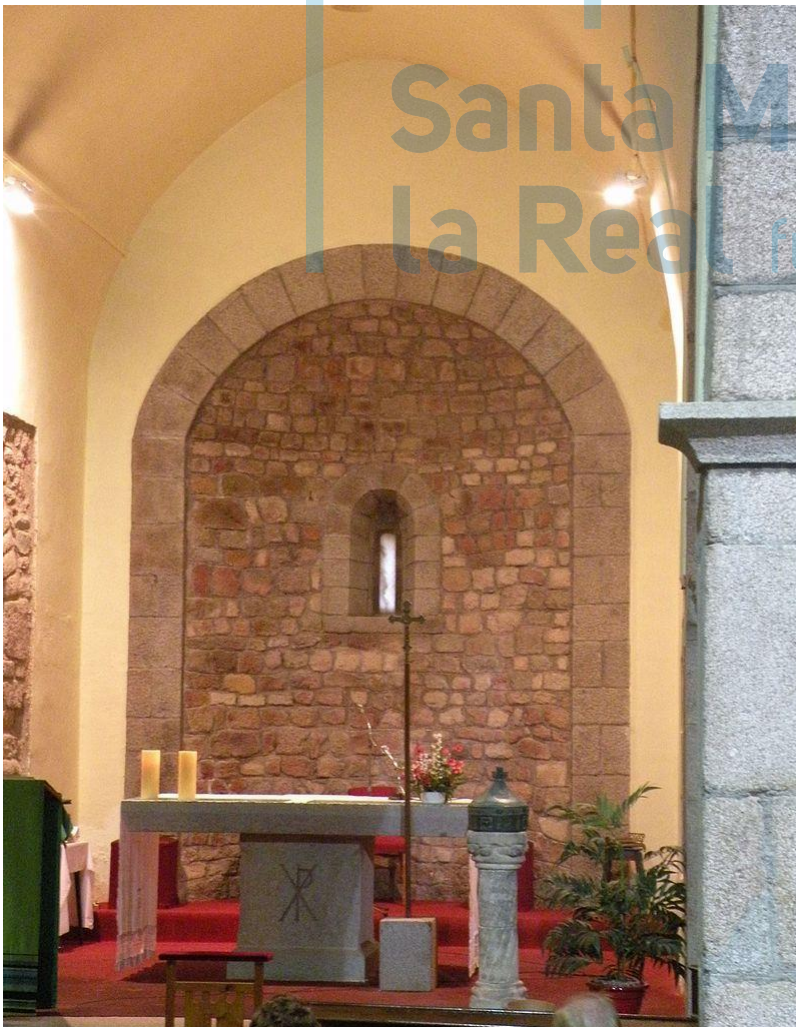
Vista general del interior del ábside y de las columnas.