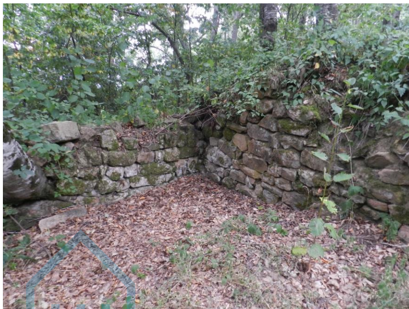
Restos de la torre

con materiales reaprovechados de antiguas estructuras de la casa fuerte. Por el tipo de construcción, pertenece al estilo de fortificación del siglo XIII.