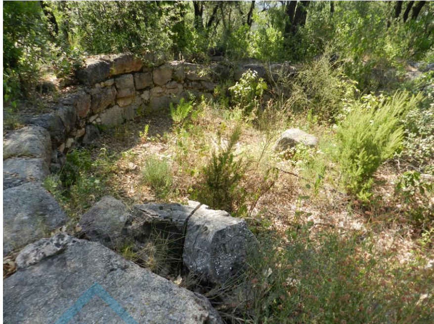
Restos de la torre