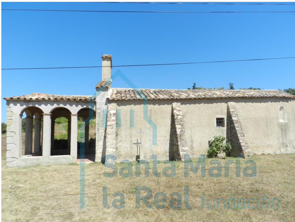
Vista general del templo

EN LA ZONA NORESTE DEL TÉRMINO DE SANT FELIU DE BUIXALLEU, en medio de unos campos de cultivo y cerca del manso que tradicionalmente ha cuidado de ella, se ubica la pequeña iglesia rural de Sant Segimon del Bosc. Su aspecto actual se debe, en parte, a una reforma importante que se llevó a cabo en el año 1508, presumiblemente para solventar los problemas ocasionados por el gran terremoto de 1427, que afectó fuertemente al edificio.