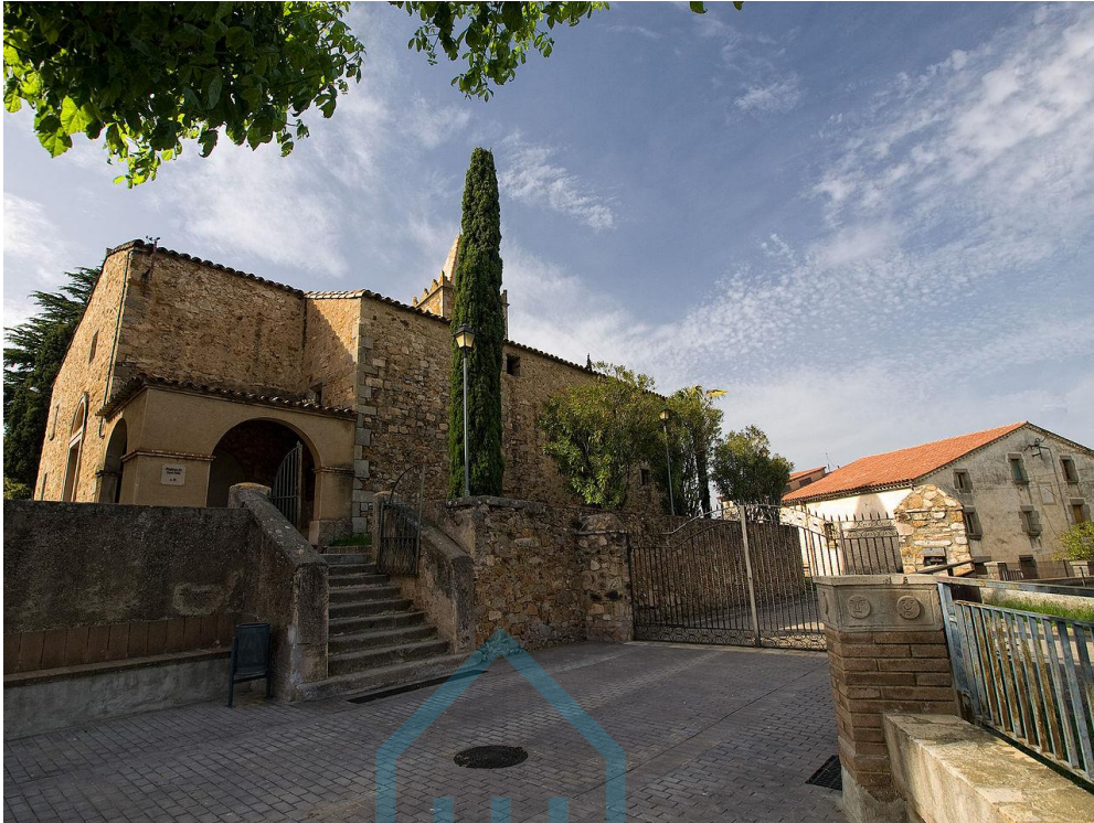
Vista actual del templo.