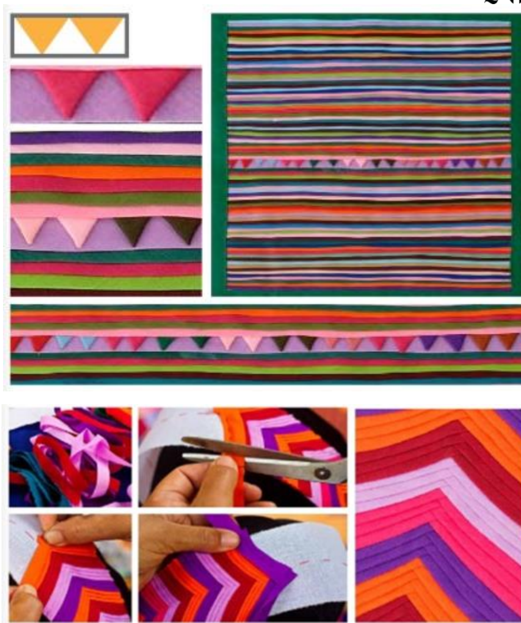
ที่มา หนังสือเอกลักษณ์และศิลปะลวดลายผ้าชาวเขา

เทคนิคการสร้างสรรค์ลวดลายผ้าปักลือชอ ประกอบด้วย เทคนิคหลัก คือ การเย็บ โดยจะเป็นการเย็บแถบผ้าเล็กๆ สลับสี และการสร้างลวดลายที่ต้องการด้วยเทคนิคการเย็บติดผ้าปะลงบนผืนผ้าแถบพื้นสีต่างๆ ซึ่งถือว่าเป็นทักษะ และความชำนาญของหญิงชาวลีชอ ซึ่งความละเอียด และความยากของเทคนิคนี้ขึ้นอยู่กับ การกำหนดขนาดของชิ้นผ้าชิ้นเล็กๆ ที่จะต้องตัดให้พอดีสำหรับการสร้างลวดลาย ขนาดชิ้นผ้าที่ตัดนั้น จะต้องไม่ใหญ่ หรือเล็กจนเกินไปจากผ้าชิ้นเล็กๆ จะถูกนำมาพับขึ้นรูปร่างเป็นลวดลายต่างๆ อาทิ สีเหลี่ยม สามเหลี่ยม แล้วจึงนำมาเย็บติดกันในลักษณะต่างๆ ตามรูปแบบของลวดลายนั้นๆ บางลวดลายอาจเป็นการเย็บต่อกันเพียงชั้นเดียว แต่บางลวดลายก็จำเป็นต้องมีการเย็บชิ้นผ้าเล็กๆ สลับซับซ้อนกันหลายชั้น กระบวนการเย็บติดผ้าแต่ละชั้น จำเป็นต้องอาศัยการเว้นระยะขนาดพื้นที่ในส่วนที่เป็นช่องว่างระหว่างชิ้นผ้า