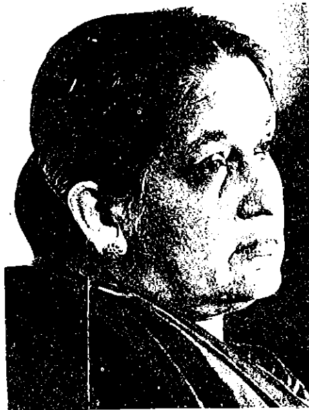
Mrs Bandaranaike, Sri Lankas premiärminister.

Det är dock knappast troligt att fru Bandaranaike kunnat köpa sig fri med detta. I raden av impopulära inrikespolitiska åtgärder har nu regeringen dessutom stängt parlamentet från den 10:e