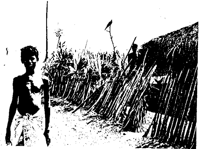
Invånaren på landsbygden i Sri Lanka är en av dem som slutgiltigt får betala i utsugningens kedja från periferin (u-världens landsbygd och fabriks-golv) till centrum (direktionsrummen i de imperialistiska bolagen i USA och Europa). Han har redan inlett sina krav på rättvisa...

Situationen för fru Bandaranaike var nu allvarlig, inte minst med tanke på de kommande valen som enligt författningen ska hållas i maj. I tidigare val har det visat sig viktigt för SLFP att ha den reformistiska vänsterns (CP och LSSP) stöd så en definitiv brytning nu skulle komma olägligt. Inte minst med tanke på att det konservativa UNP vunnit många fyllnadsval sen 1970.