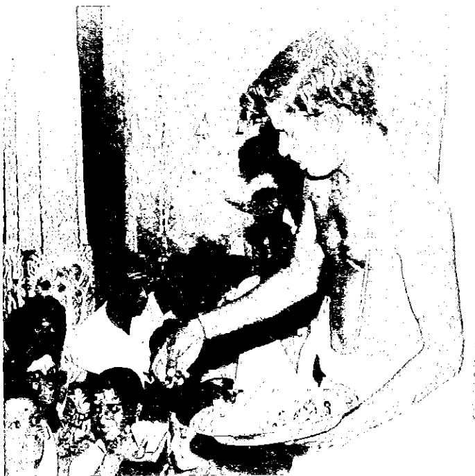
20-punktsprogrammets propagandaeffekt byggde på utdelning av favörer till befolkningen (lån, tomter etc.), d v s samma mekanism som vid denna sötsaksutdelning under Pongalhögstiden.

I det nordindiska bältet var mass-steriliseringen mest intensiv; och denna kampanj är ett uttryck (men det viktigaste) för de diktatoriska metoderna inom Kongresspartiet (och kanske också i administrationen). I en rapport citeras en Kongressmedlem av delstatsparlamentet i Uttar Pradesh: Vid ett tillfälle befann han sig på resa i sin egen valkrets och blev vittne till hur polisen släpade bort en fattigbonde för sterilisering. Eftersom han var väl känd för poliserna frågade han: »Vad gör ni?» »Det har ni inte med att göra», blev svaret. Kongressmannen blev alltså förolämpad inför ögonen på sina valmän av ett par vanliga polis-konstaplar på ett sätt som tidigare varit helt otänkbart. Detta illustrerar, inte bara varför gensvaret på jordbruksminister Jagjivam Rams avhopp från Kongressen blev ganska stort, utan också varför partiets valkampanj blev så lam, och till vissa delar passivt motarbetades av de egna partiarbetarna.