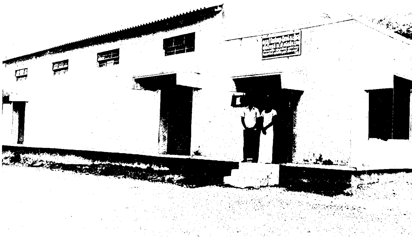
Bakom 20-punktsprogrammets stolta fasad var det ganska tomt, precis som i kooperativets lagerbyggnad i Thaiyur, som i januari -77 innehöll en säck konstgödning.

Kampen mot ockrarna verkade framgångsrik så länge man höll sig i städerna: pantlånarnas butiker hade stängts eller förvandlats till vanliga affärer. Men på landet fanns de kvar. De opererade kanske mera försiktigt, men det drabbade mest låntagarna: det blev svårare att få lån; panterna värderades lägre, betalningsvillkoren skärptes.