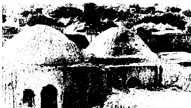
Lerhus med kupoler från trakten av Balkh i norra Afghanistan.

Den ekonomiska strukturen i stort ser, fortfarande, ut som en triangel. Dess hörn utgörs av irrigationsjordbruket, boskapsnomadismen och basareernas hantverk och handel. Marknadsplatserna förbinds med grusvägar trafikerade av lastbilar, kameler och åsnor. Det finns en genomgående asfaltväg med avstickare upp till ryska gränsen. Det finns ingen järnväg. Det finns nästan ingen industri.