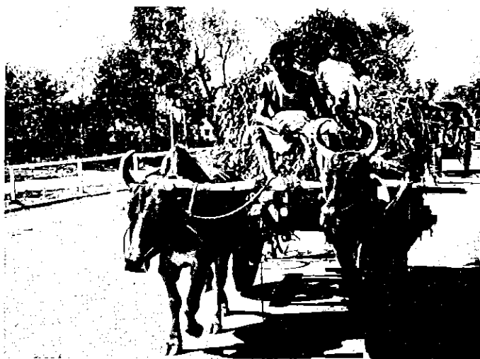
Oxspann på Gulbarg Road i Lahores utkanter.

Valresultatet berodde på valfusk, tillkännagav oppositionen. Den reste krav på Bhuttos avgång, tillsättande av en expeditionminister och nyval under militär kontroll. PNA vägrade inta de 36 platser man vunnit i parlamentet, utlyste generalstrejk och vägrade delta i valen i de fyra provinserna, val som skulle hållas ett par dagar senare. I Karachi, oppositionens högborg, och på många andra platser väckte anmaningarna till generalstrejk anklag, trots att regeringen några timmar efter valet återinfört undantagstillstånd. Oppositionsanhängare attackerade fordon och kommunikationsmedel; när järnvägsräls började rivas upp på Karachis bangård inskred utposterade trupper. Oroligheter utbröt även på andra håll. I Rawalpindi kostade strider mellan rivaliserande partier dödsoffer.