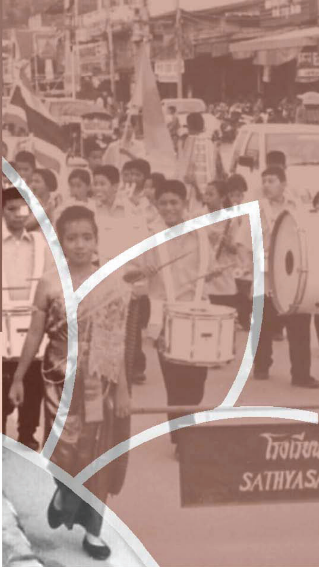
Marcia Tailandese Contro la Droga