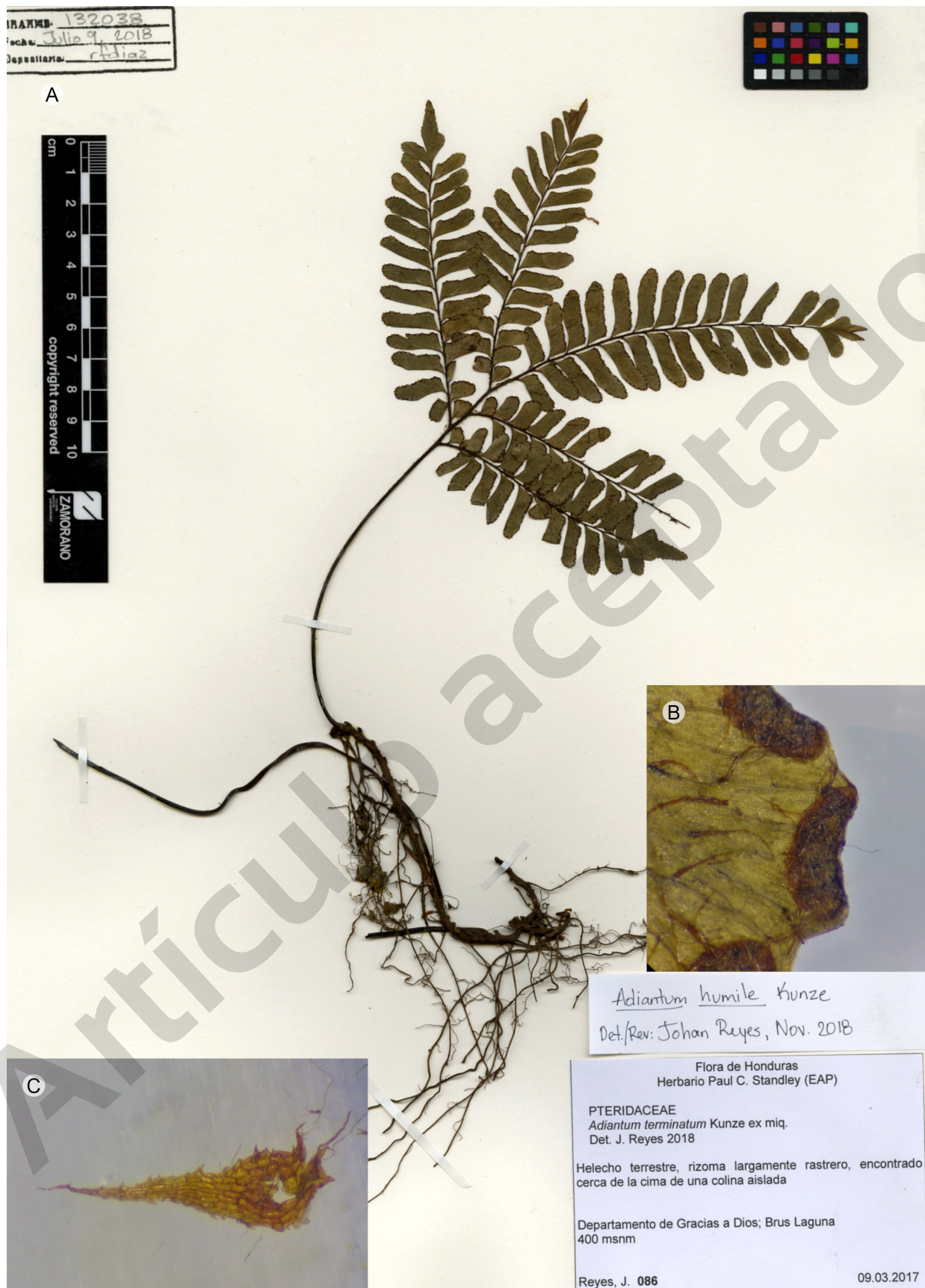
Figura 2: Adiantum humile Kunze. Muestra herborizada, A. rizoma largamente rastrero y pinnulas; B. indusio; C. escamas del rizoma clatradas y denticuladas. J. Reyes 86 (EAP).