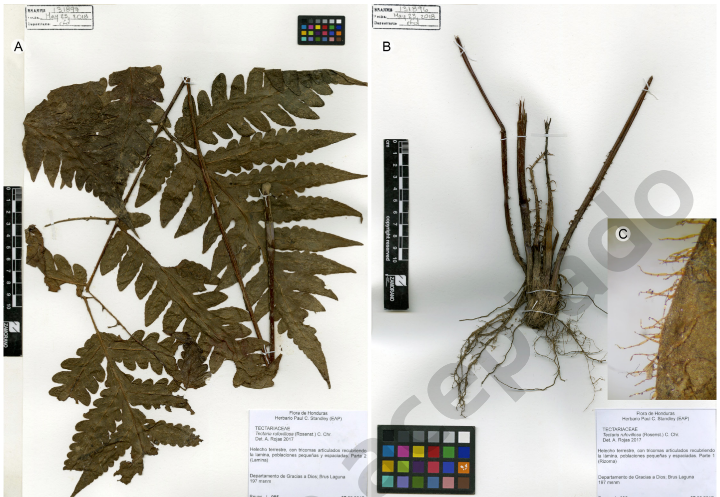
Figura 4: Tectaria ruvifilosa (Rosenst.) C. Chr. Muestra herborizada. A. lámina; B. rizoma y escamas; C. tricomas articulados. J. Reyes 85 (EAP).

especies, no se registra en Honduras. No obstante, dos especies de este grupo ( Cyathea austroamericana Domin y Cyathea grayumii Rojas) sí lo están, por lo que al no estar citado el material correspondiente a la reserva, no se puede verificar cuál de estas estaría presente y se decide dejar el nombre Cyathea multiflora como sinónimo.