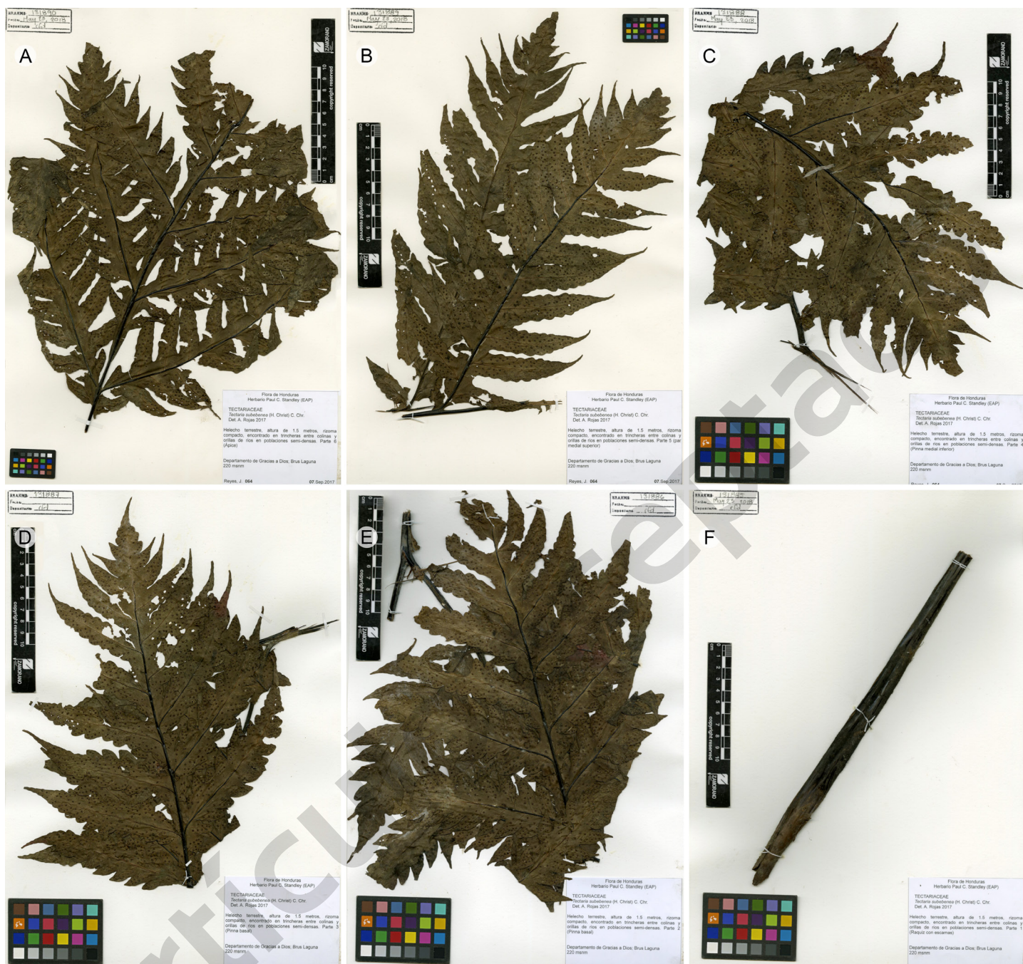
Figura 5: Tectaria subebeneae (Christ) C. Chr. Muestra herborizada. A. ápice; B. pinnas superiores; C. pinnas medias; D. pinna basal izquierda; E. pinna basal derecha; F. raquis. J. Reyes 64 (EAP).

de la frontera agrícola y ganadera, la construcción de represas hidroeléctricas y la apertura de caminos y carreteras. Estas amenazas pudieron ser observadas durante los vuelos a la zona de estudio y debido a las visitas prolongadas, mostraron en un año un avance descontrolado de la frontera agrícola que amenaza con destruir estos ecosistemas.