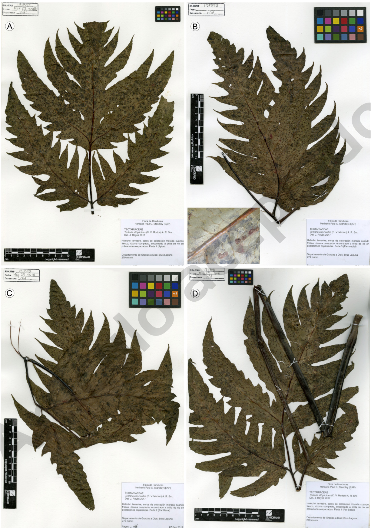
Figura 3: Tectaria athyrioides (Baker) C. Chr. Muestra herborizada. A. ápice; B. pinnas medias; C. soros en forma de J; D. pinna basal izquierda; E. pinna basal derecha y raquis. J. Reyes 95 (EAP)