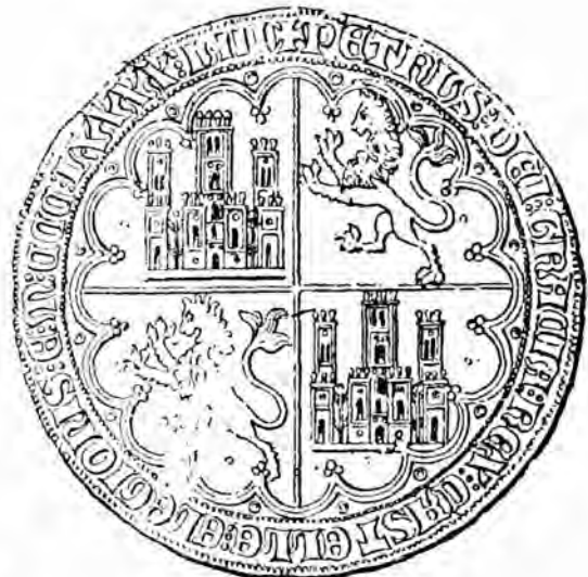
Figs. 17 a 19

Monedas árabes (dinar y dobra) y gran dobla de Pedro I de Castilla. También en este caso la moneda española gira en torno a la musulmana, pero esta vez sólo en el sistema de valores y no en el arte. La situación es distinta y nos muestra así (compárese con la fig. 16) la complejidad y variedad de campo de aplicación que pueden tener las influencias que el Mediterráneo contribuyó a transmitir. Ello se debe a que el mar sólo es un elemento a tener en consideración (medio de comunicación) y las relaciones monetarias están también condicionadas por otros elementos (políticos, económicos, etc.). (MATEU, La moneda española , págs. 166 y 198.)