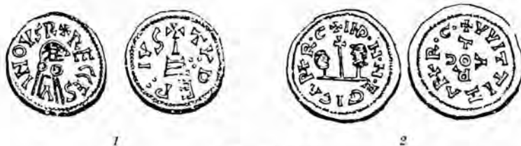
Figs. 1 y 2

En un principio aún preponderó la herencia monetaria romana, dándose el fenómeno frecuente del retraso de la evolución monetaria sobre la política, que hemos estudiado en otras ocasiones y a cuyas causas generales se unía en este momento la superioridad de la estructura técnica y cultural de la vida monetaria romana sobre la germánica. Y, además, los bizantinos se extendieron por todo el Mediterráneo; tierra adentro, el sueño de Justiniano de restaurar el Imperio no resultó viable, pero en las costas casi sí. Su expansión política, en el aspecto monetario, se vió facilitada por el precedente; es decir, por extenderse a países por los cuales circulaba aún monedaje de base romana, lo cual creaba un hábito a aquel sistema que, por lo menos, había de suprimir dificultades al desarrollo del numerario de filiación bizantina (1).