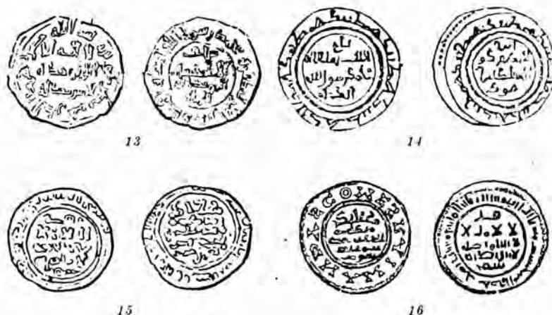
Figs. 13 a 16

flicto con el Papado, por censurar éste la emisión de moneda con inscripciones infieles. El mismo planteamiento de la cuestión desde este ángulo, nos muestra que no se apreciaba en estas imitaciones el defecto moral implícito en una imitación con intención fraudulenta, que no existiría por no pretenderse hacer piezas de menos valor que las originarias, para defraudar a sus usuarios. Cuestión aparte es el defecto de indole jurídica y ética que pueda haber en utilizar los símbolos de otro poder público sin la autorización de éste y sobre el cual se carece de autoridad. En todo caso, el móvil mercantil mediterráneo de estas acuñaciones parece claro (1). Si el Papado no se equivocó en este particular, parece, en cambio, haber tenido un criterio demasiado severo, demasiado influido quizá por lo formal en