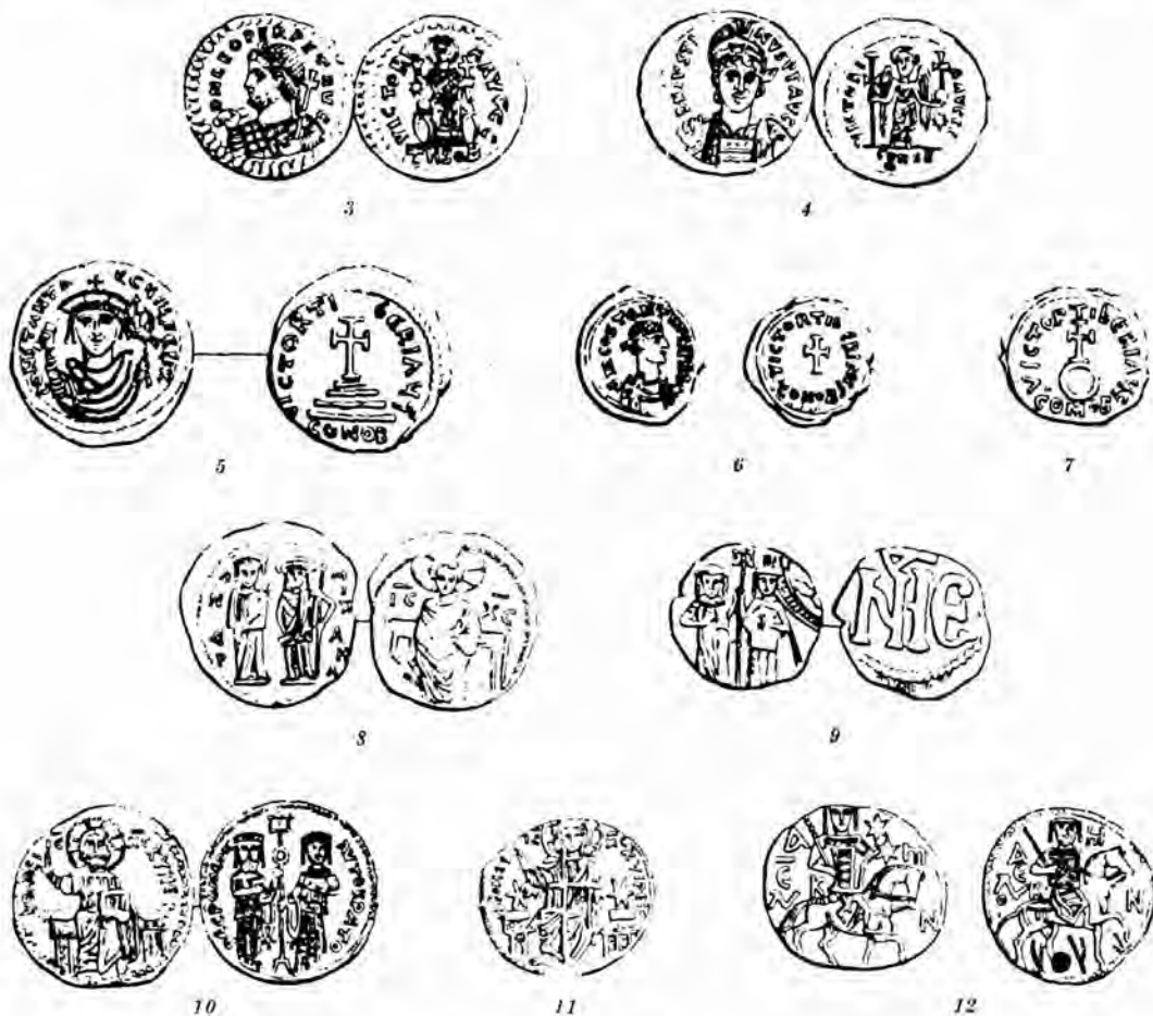
Figs. 3 a 12