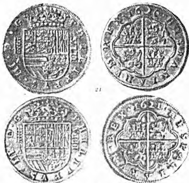
Figs. 24 y 25

Con todo esto, el Mediterráneo se vió aún más desplazado, dejó de ser el eje del comercio y, por ende, del mundo monetario. Decayeron los imperios marítimos de las repúblicas italianas, y esta decadencia se manifiesta en que sus mo-