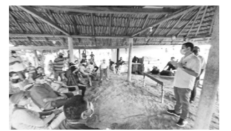
La socialización se realizó ayer.