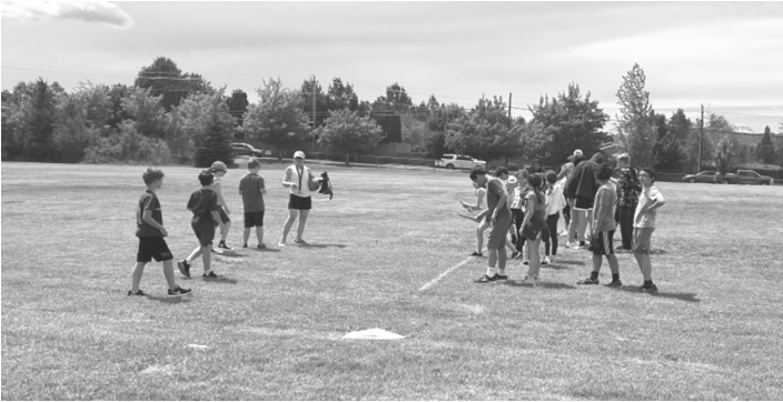
Las tradiciones de fin de año escolar crean recuerdos maravillosos. La escuela intermedia terminó el día de campo con un torneo de kickball por la tarde.

La visión de nuestra escuela es inspirar a académicos motivados para servir y guiar al mundo con fe y carácter moral.