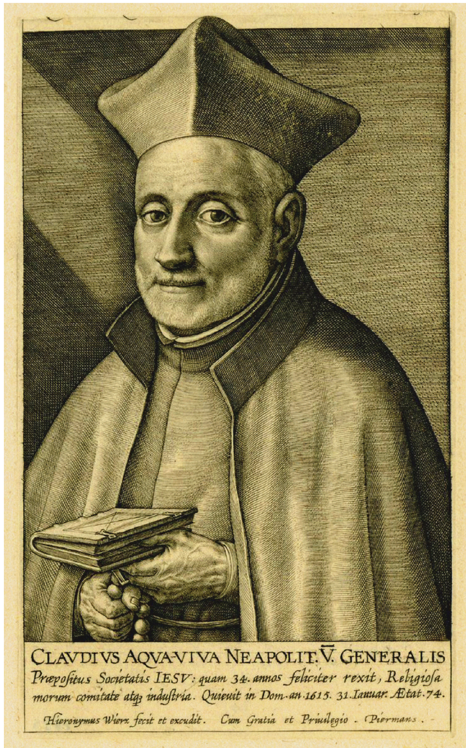
Retrato del general de los jesuitas Claudio Acquaviva (1615-1619)

las reducciones contra las incursiones (malones) de los paulistas brasileños o de los indígenas. Las reducciones se situarán al sur del río Tebicuary y formarán poco a poco una entidad política