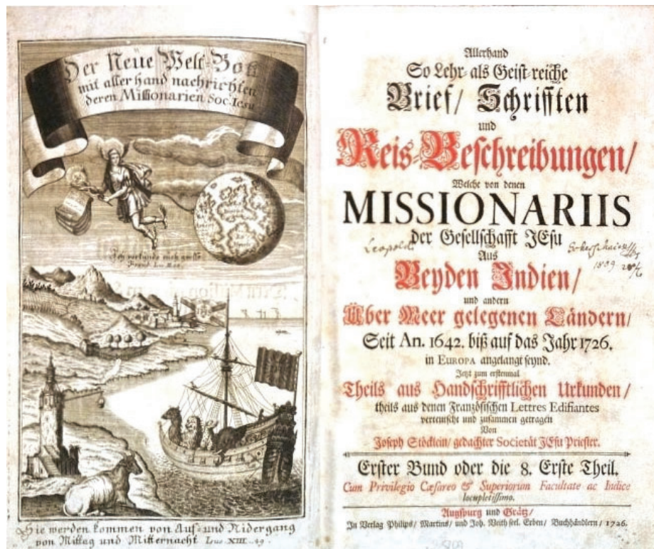
Neue Welt Bott (Der) mit Allerhand Nachrichten dern Missionariorum...

Muriel, Domingo, Historia del Paraguay desde 1747 hasta 1767 . Trad. de Pablo Hernández, Madrid, 1919.