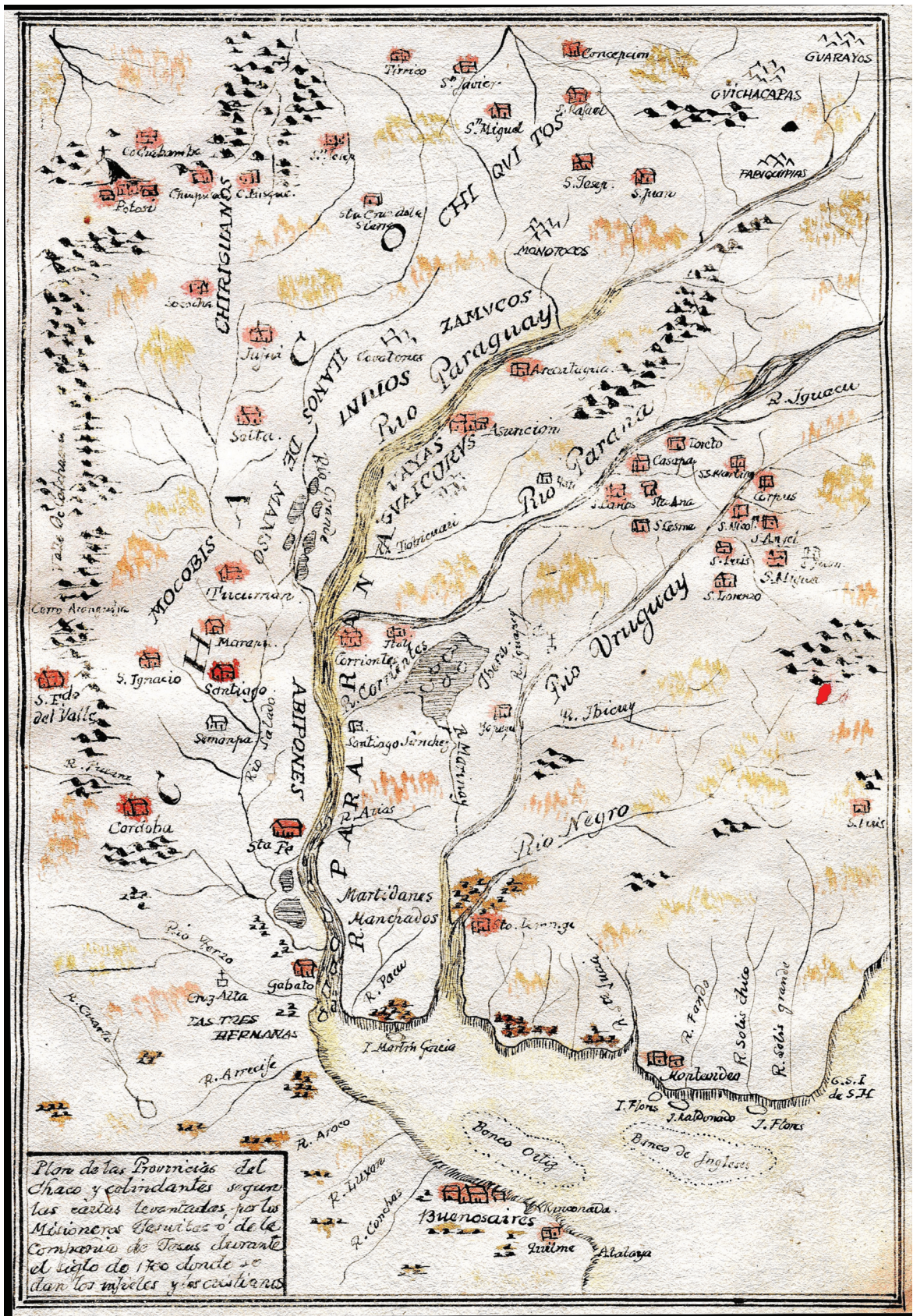
José de Arévalos S.J. Acuarela original, donde están indicadas la reducciones del Paraguay (hacia 1760). (Plan de las Provincias del Chaco y colindantes según las cartas levantadas por los Misioneros Jesuitas de la Compañía de Jesús durante el siglo de 1700, donde se dan los infieles y los cristianos).