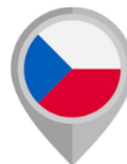
SEZNAM SVĚTOVÉHO DĚDICTVÍ V ČR