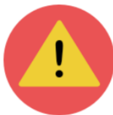
SEZNAM SVĚTOVÉHO DĚDICTVÍ V OHROŽENÍ