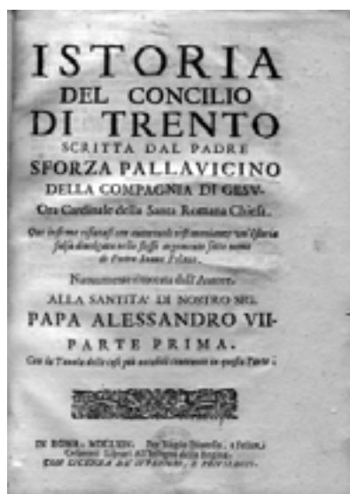
620. Pallavicino Sforza