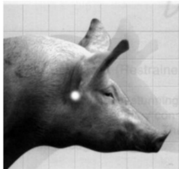
Elektrodenansatz Schwein Kopfdurchströmung