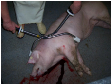
Elektrodenansatz Schwein Brustdurchströmung