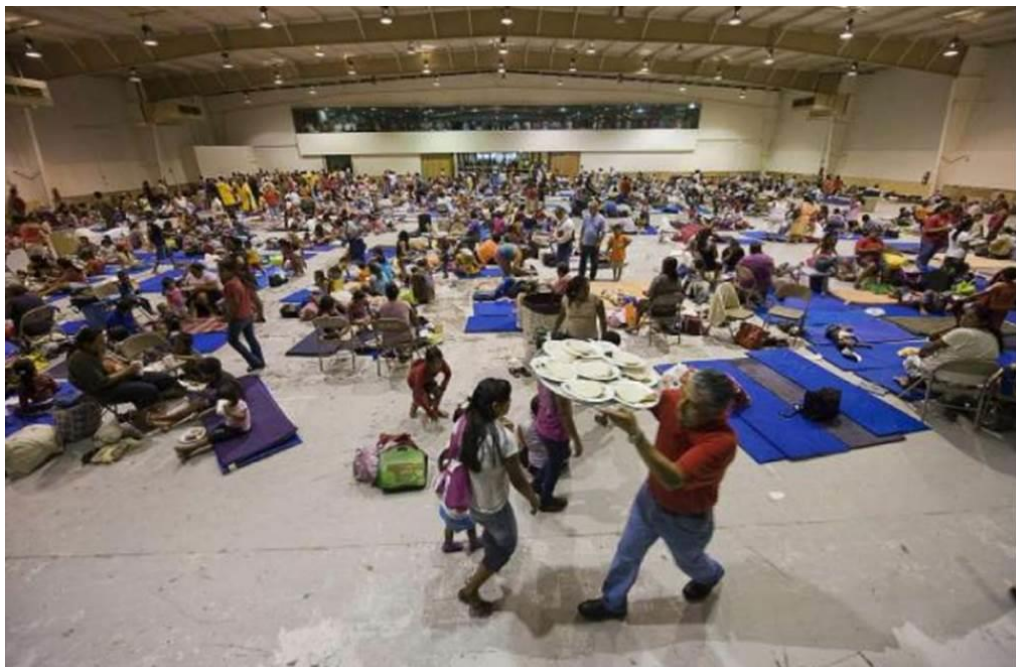
Refugio Temporal Centro de Convenciones. Matamoros, Tamaulipas.

....El Refugio Temporal debe ser permeable y participativo a la superación de la emergencia con los programas de rehabilitación y reconstrucción que el gobierno esté manejando. La utilización del Refugio Temporal será tan corta como las soluciones se concluyan y entreguen a los damnificados.