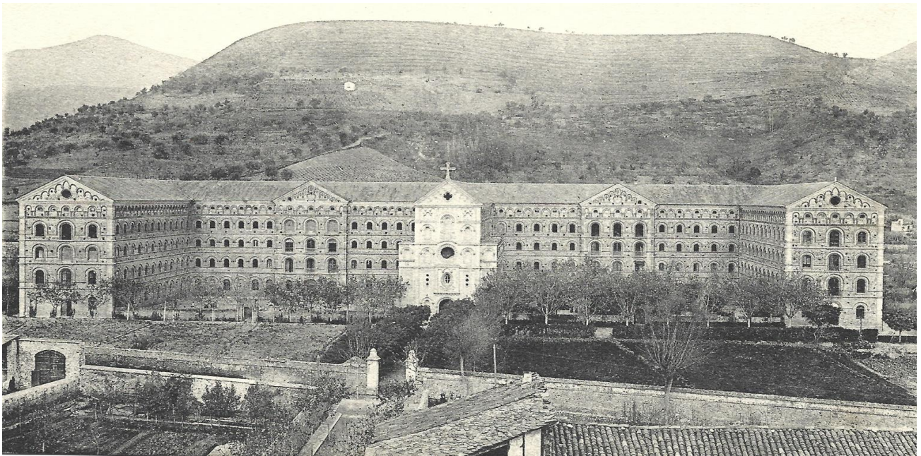
El nou Seminari conciliar de la Seu d'Urgell, la construcció del qual obeí a la iniciativa del prelat Josep Caixal i Estradé. Col·lecció de postals de l'autor.