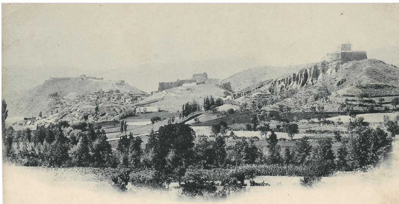
Vista de les tres forteses principals que dominaven la Seu d'Urgell. D'esquerra a dreta, la imponent Ciutadella (al fons), el Castell, a tocar de Castellciutat (al centre) i la Torre de Solsona (a la dreta), que vigilava el camí d'Andorra.