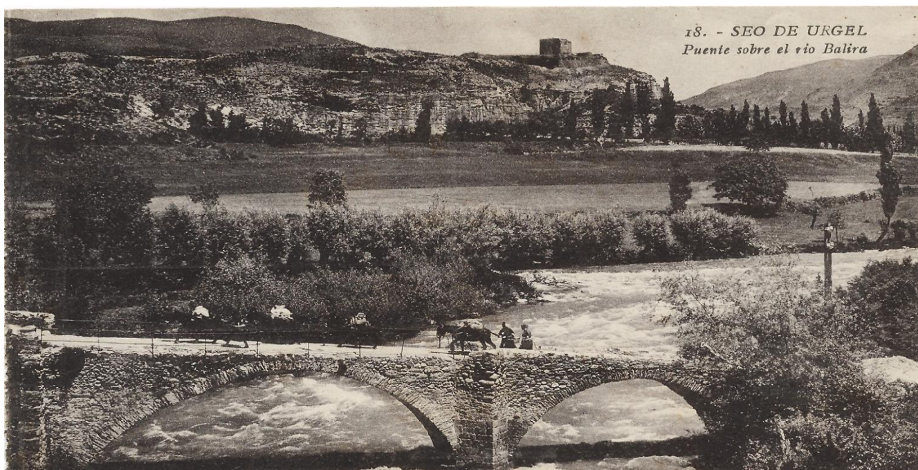
L'antic pont de pedra sobre el riu la Valira, en la confluència amb el Segre, que unia la Seu d'Urgell amb la vila de Castellciutat. Al fons la Torre de Solsona.