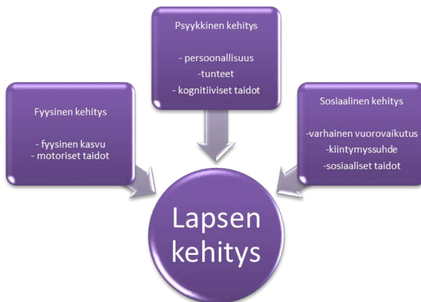
Kuvio 1: Lapsen kehityksen osa-alueet (mukailten Kronqvist & Pulkkinen 2007)

Tässä opinnäytetyössä keskitymme kuitenkin kuvaamaan tarkemmin vain lapsen psyykkistä ja sosiaalista kehitystä jättäen fyysisen kehityksen opinnäytetyömme ulkopuolelle, koska fyysiseen kehitykseen kuuluvan fyysisen kasvun sekä motorisen kehityksen mukaan ottaminen laajentaisi opinnäytetyön aihetta liikaa.