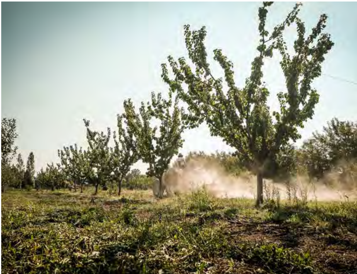
Reportage La Durette

Los mayores logros de los movimientos de base en materia de acceso a la tierra no solo incluyen tener mejores alimentos, sino también ciudadanos más comprometidos, activos y empoderados. Estas iniciativas y prácticas pueden ampliarse y aplicarse a nuevos espacios, según los contextos y las necesidades de las comunidades locales y en el marco de un entorno político, legislativo e institucional propicio, y se detallan en la publicación «Tu tierra, mi tierra, nuestra tierra: Estrategias de base para preservar las tierras de cultivo y el acceso a la tierra para la agricultura campesina y la agroecología». Este informe pretende destacar las políticas necesarias y disponibles a todos los niveles para apoyar estas iniciativas transformadoras.