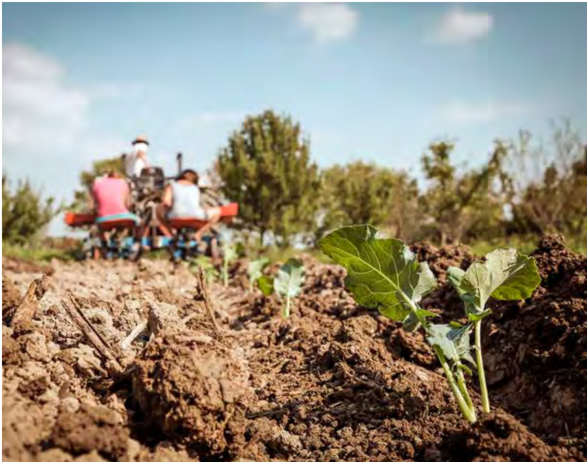
Reportage La Durette

Mientras tanto, un próspero ecosistema de alternativas políticas está arraigando en toda Europa. Los legisladores en toda Europa tienen la capacidad y oportunidad de apoyar una visión nueva y transformadora, que va desde los agricultores y agricultoras individuales y las innovaciones a nivel comunitario, pasando por las autoridades locales y los proyectos regionales para mantener sistemas alimentarios resistentes y sostenibles construidos en torno a explotaciones agroecológicas a pequeña escala, hasta un número cada vez mayor de propuestas para una verdadera transformación a nivel nacional y de la UE.