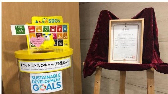
本社1Fに設置したキャップ回収容器と感謝状

東海テレビで2021年1月から本社1階ロビーに、ペットボトルキャップの回収容器の設置を始めて1年半、これまでに約370kg、16万個相当を回収し、ポリオワクチンで185人分寄付をすることが出来ました。（2022年7月19日現在）。100人分を超えた11月には、活動を主催するNPO法人から感謝状をいただきましたが、今年に入り、さらに回収のペースが上がっています。これからも、引き続き取り組んでまいります。