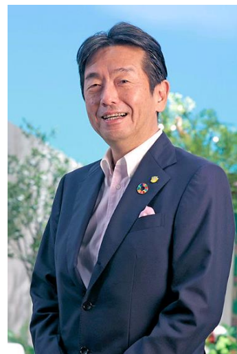
東海テレビ放送株式会社 代表取締役社長