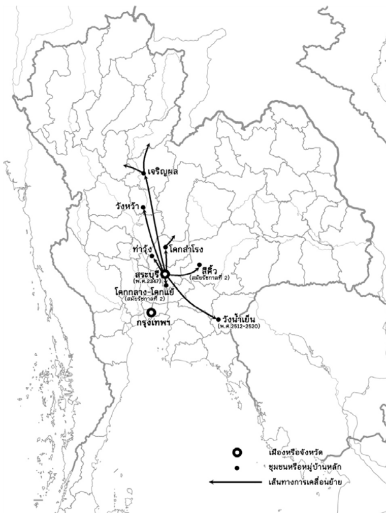
รูปที่ 2 แผนที่แสดงถิ่นฐานใหม่และการเคลื่อนย้ายของชาวยวนเชียงใหม่และชนกลุ่มเมืองสระบุรี