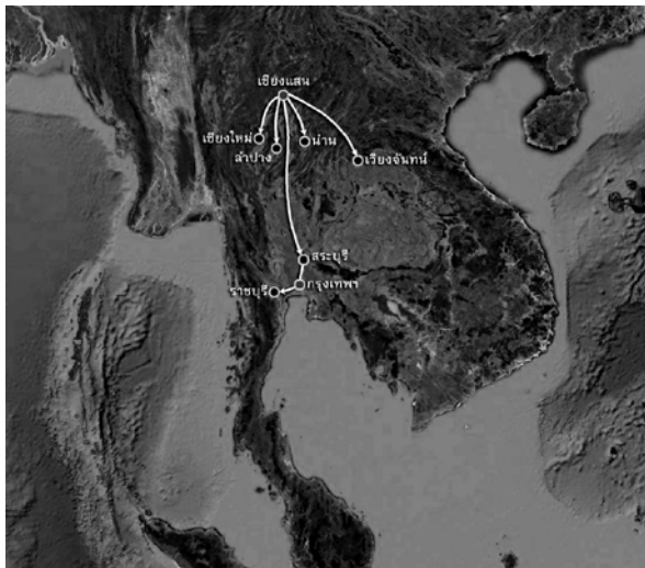
รูปที่ 1 แสดงการเคลื่อนย้ายประชากรชาวยวนจากเมืองเชียงแสนเข้าสู่หัวเมืองล้านนา เวียงจันทน์ และตอนกลางของประเทศไทย

วารสารมนุษยศาสตร์และสังคมศาสตร์ ปีที่ 8 ฉบับพิเศษธันวาคม 2560 อาเซียน: แรงงานกับการพัฒนา 1166 ปีชวดฉก (พ.ศ.2347) เป็นปีที่ 23 ในรัชกาลที่ 1 เมื่อเดือน 5 กรมหลวงเทพหริรักษ์ พระยายมราช นายทัพ นายกอง ไทย ลาว (หมายถึงยวนล้านนา; ลาวพุงดำ และ ลาวล้านช้าง; ลาวพุงขาว) ก็ยกขึ้นไปเมืองเชียงแสน พม่ามิได้ออกสู้รบ เป็นแต่รักษาเมืองมั่นอยู่ กองทัพเข้าตั้งล้อมเมืองอยู่เดือนเศษจะหักเอามิได้ ด้วยพม่าอยู่ประจำรักษาหน้าที่และบนกำแพงเมืองเป็นสามารถ และกองทัพก็ขัดเสบียงอาหาร แล้วได้ข่าวว่ากองทัพเมืองอังวะจะยกมาช่วยเมืองเชียงแสน ครั้นเดือน 6 ข้างแรมเป็นเทศกาลฝนตกประปรายลงมาแผ่นดินก็ร้อนขึ้น ผู้คนในกองทัพเจ็บป่วยมาก ... ..กรมหลวงเทพหริรักษ์ก็ให้ล่าทัพลงมา ยังแต่ทัพลาว พวกลาวในเมืองเชียงแสน อุดเสบียงอาหาร ฆ่าโค กระบือ ช้าง ม้า กินจนสิ้น พวกลาวชาวเมือง (เชียงแสน) ก็ยอมสวามิภักดิ์แก่กองทัพเมืองลาว... ..กองทัพได้ครอบครั 23,000 เศษ ก็รื้อกำแพงเผาบ้านเมืองเสีย แล้วแบ่งครอบครัวกันเป็น 5 ส่วน ให้ไปเมืองเชียงใหม่ส่วน 1 เมืองนครลำปางส่วน 1 เมืองน่านส่วน 1 เมืองเวียงจันทน์ส่วน 1 อีกส่วน 1 ถวายลงมา ณ กรุงเทพฯ โปรดให้ตั้งบ้านเรือนอยู่เมืองสระบุรีบ้าง แบ่งไปอยู่เมืองราชบุรีบ้าง...”