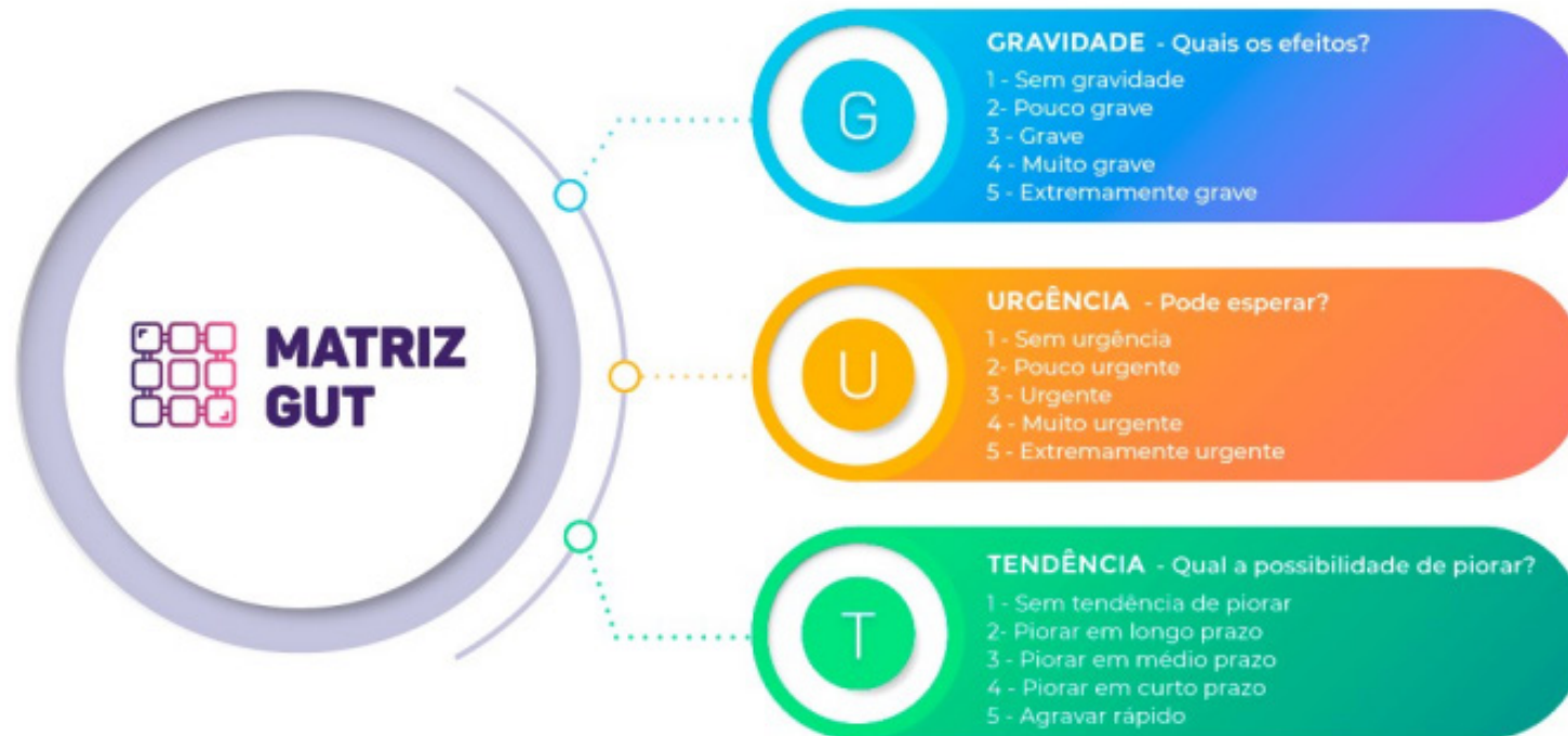
Figura 3 – Matriz GUT

Os resultados desse processo são apresentados nas seções seguintes deste documento.