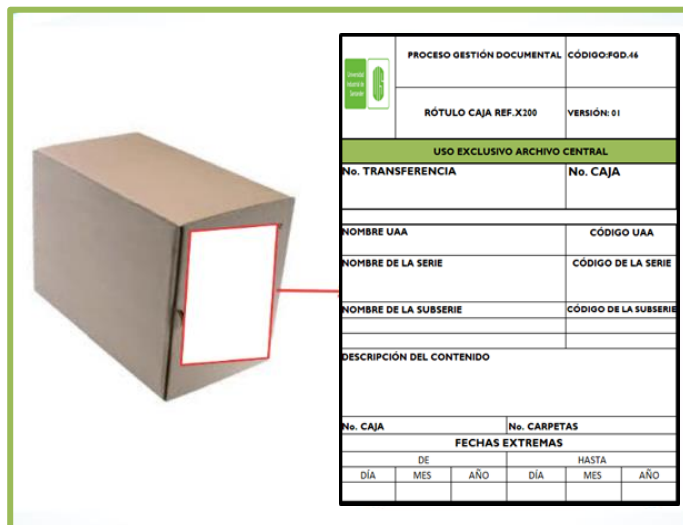
Rótulo Caja Ref X200 FGD.46