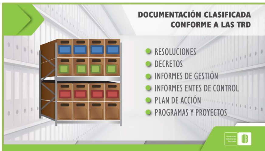
Ejemplo de estante con series y subseries clasificadas

PASO 5. Clasificación de las series y subseries. Mantiene físicamente separadas las series y subseries de su UAA conforme a los nombres y códigos dados por las TRD, de tal manera que se puede evidenciarse en las carpetas su correcta clasificación. Visualmente en el archivo de gestión debe evidenciarse que la documentación está clasificada por series y subseries.