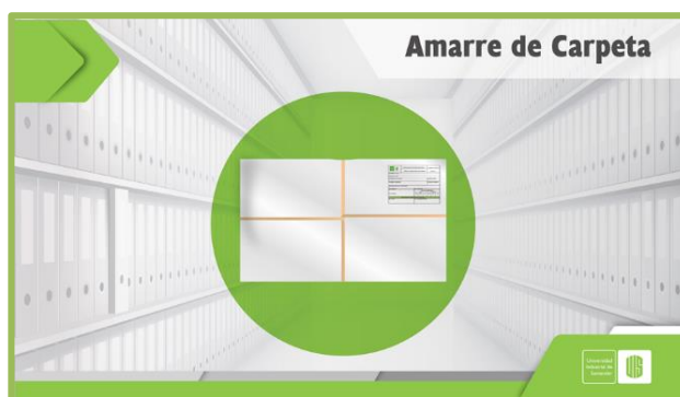
Amarre de Carpeta

Como se debe realizar el amarre de las carpetas