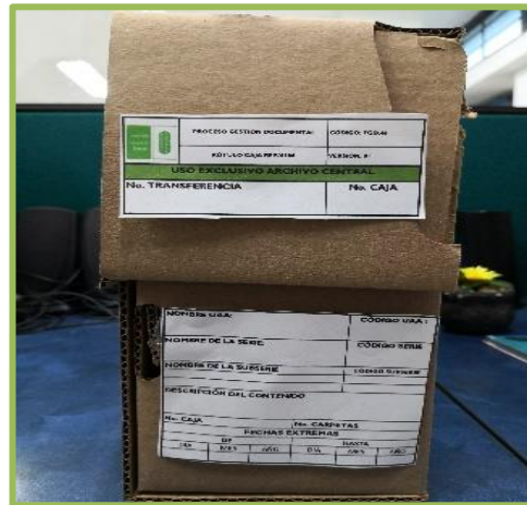
Rótulo Caja Ref X100 FGD.46