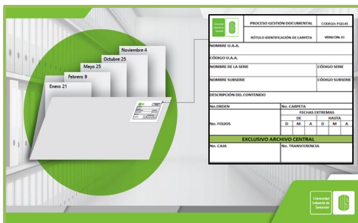
Carpeta identificada en razón a las TRD.

Las carpetas del archivo de gestión se deben rotular correctamente para garantizar su identificación, de tal forma que permita su fácil ubicación y recuperación.