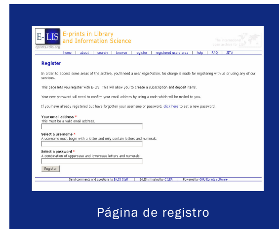
Página de registro

Cualquier problema legal relacionado con el copyright es exclusiva responsabilidad de los autores. E-LIS no se responsabiliza de los contenidos o las opiniones remitidas al Archivo.