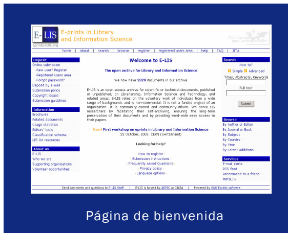
Página de bienvenida

Se invita a bibliotecarios, bibliotecas, instituciones de investigación, docentes y a todo tipo de organizaciones e investigadores individuales a hacer uso de los contenidos de E-LIS, y a enviar sus contribuciones al mismo.