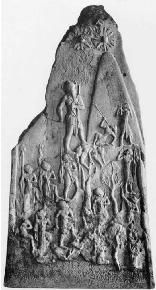
Abb. 2: Die Siegesstele des Naram-Sin (Sb 02).

Der früheste Beleg für Lullubum stammt aus frühdynastischer Zeit (ca. 2900–2350 v. Chr.). 50 Im vorliegenden Zusammenhang von besonderer Bedeutung ist die berühmte Narām-Sîn-Stele, die in Wort und Bild den Sieg des altakkadischen Herrschers Narām-Sîn (2261–2206 v. Chr.) 51 über die Lullubäer dokumentiert. 52 Die entsprechende Inschrift ist nur fragmentarisch erhalten und durch eine