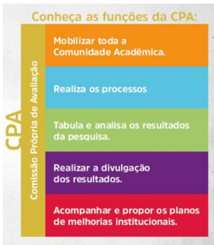
Figura 3 – Funções CPA