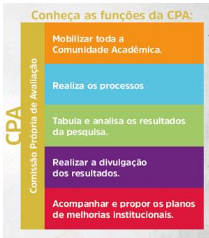
Figura 3 – Funções CPA