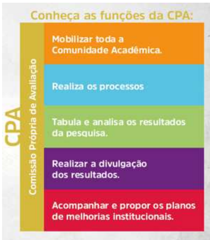
Figura 3 – Funções CPA