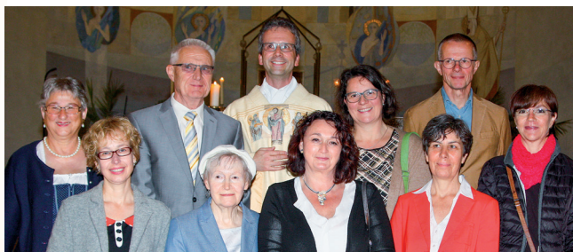
Unsere neuen Hospizhelfer des Kurses 2018/2019

Große Freude bereitete es, dass die im Haus angebotenen Fortbildungen sehr großen Zuspruch fanden. 2019 stand das Thema „Prämortale Trauer“ im Vordergrund. Die Anmeldezahlen waren so hoch, dass wir die Fortbildung an zwei Tagen anbieten mussten.