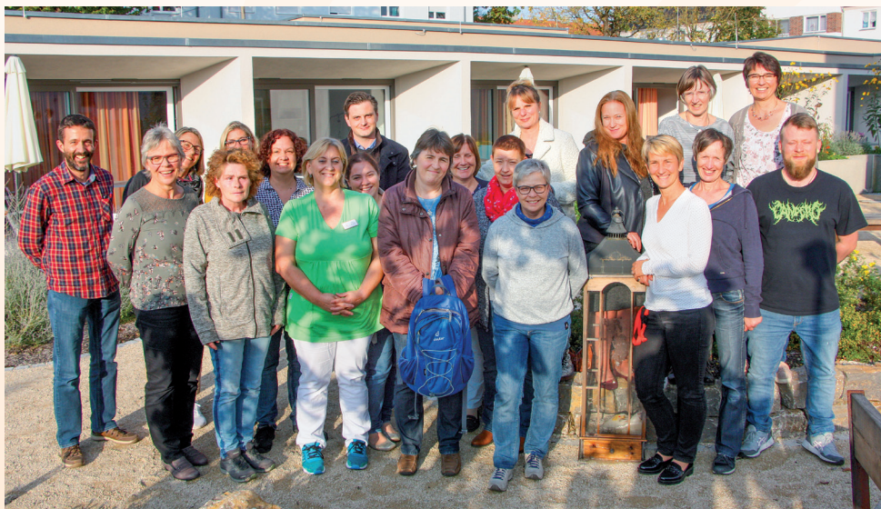
Das Stationsteam steht für intensive, fachlich fundierte und ganzheitlich orientierte Pflege. Für das Foto ist daher immer nur ein Teil der Mitarbeitenden abkömmlich.