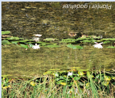
Planter i gadekær