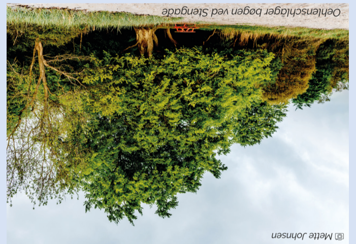
Øhavsstien fra Lohals over Tranekær til Stengade Strand

Øhavsstien fra Lohals over Tranekær til Stengade Strand – ca. 29 km Stien begynder i Lohals og er de første mange kilometer præget af havet og stranden med langs Langelands vestkyst med smukke hav- og toppe af høje kystklinter. Fra Kohave løber stien tværs over øen gennem Tranekær By til Langelands mere flade østkyst med den smukke Stengade Strand. Folderen beskriver med udgangs-