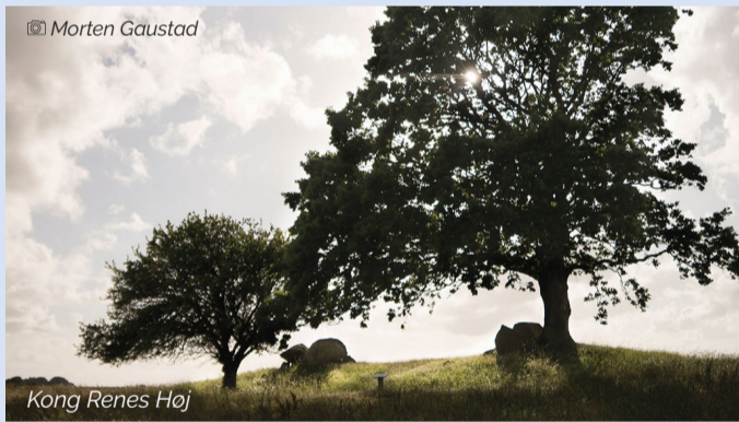
Kong Renes Høj

Stendysser og jættestuer Langeland har mange jættestuer og stendysser. En stendysse stammer fra den tidlige bondestenalder og havde enten form som en kreds (runddysse) eller et rektangel (langdysse) med et eller flere kamre, som var enkeltmandsgrave. Jættestuerne opstod i den senere bondestenalder og var et rummeligt sten-bygget gravkammer med plads til flere lig. Øhavsstien passerer en jættestue ved Bukkeskov (15) og en langdysse nord for Kohave (15).