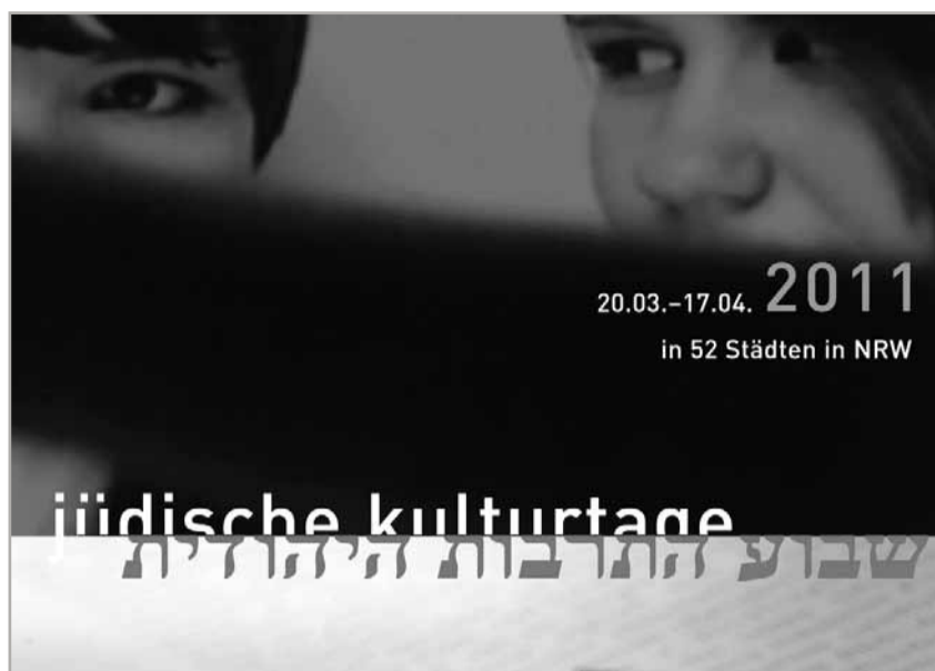
Brücken bauen: Jüdische Kulturtage in NRW eröffnet