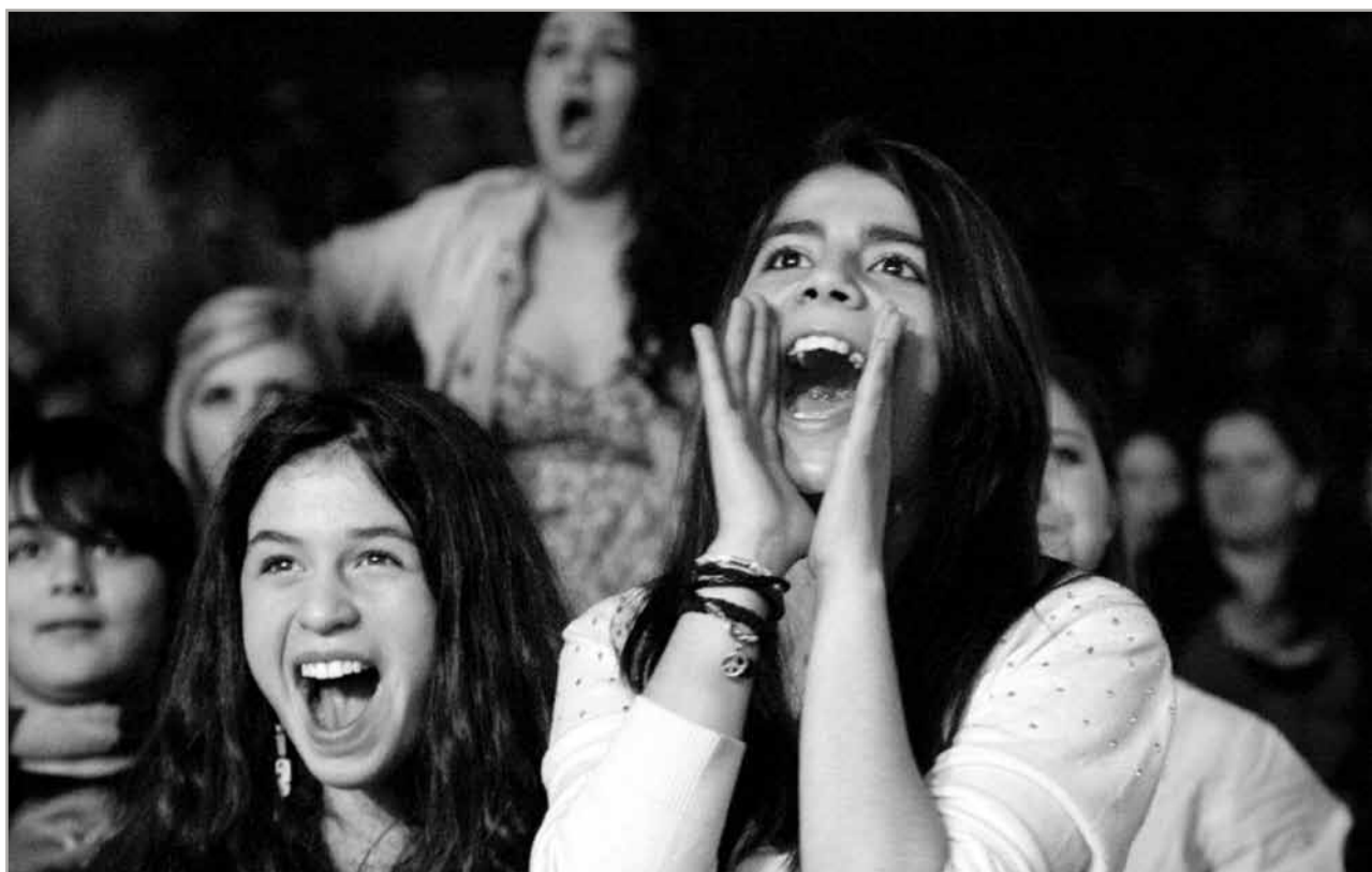
Begeistert: Junge Zuschauerinnen bei der 10. Jewrovision

Den wohl schwersten Part des Abends hatte das Stuttgarter Jugendzentrum Halev, denn es eröffnete den Wettbewerb – und zwar mit einer fulminanten Lichtshow. »Es sind die Träume, die uns Hoffnung geben«, sangen die Baden-Württemberger. Bevor die Bremer vom Jugendzentrum Atid mit Plüschteddys und viel Gefühl zeigten, was in ihnen steckt, traten die Jugendlichen von Re'ut