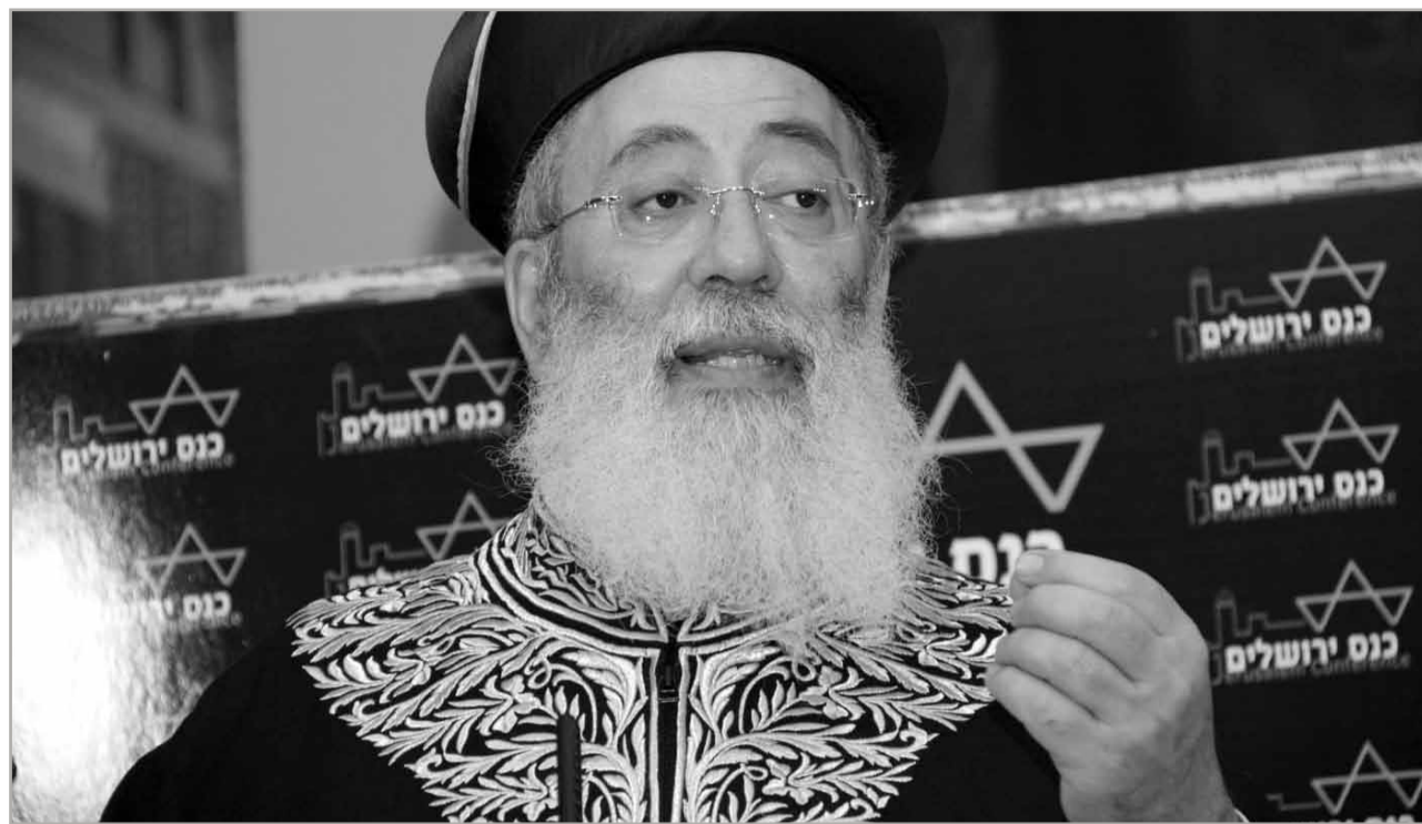
Entscheidung: Oberrabbiner Schlomo Mosche Amar ist in Israel für die Anerkennung von Übertritten zuständig

In Israel wird der Streit um Übertritte nicht nur auf theologischer,