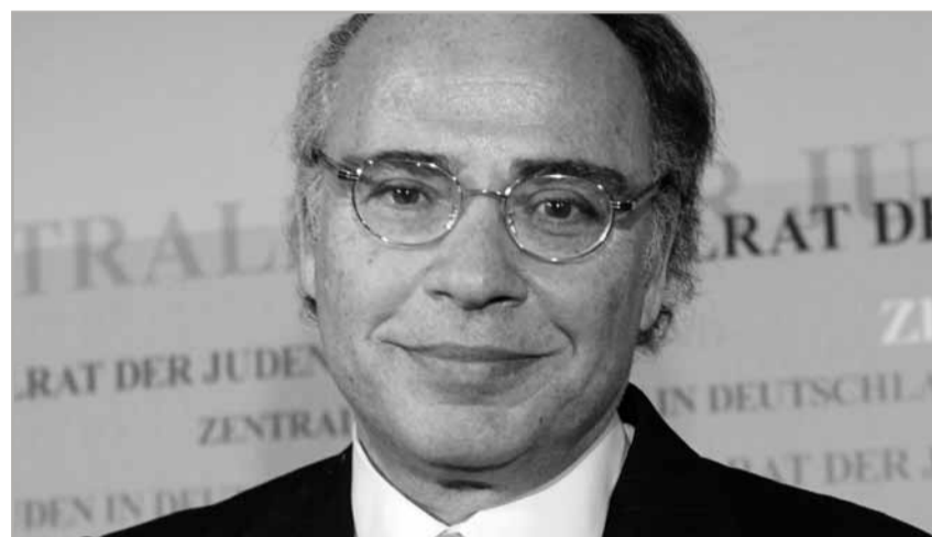
Pessach: Zum Fest der Freiheit mahnt der Zentralratspräsident auch unsere Verantwortung an

Wir müssen uns auch aktiv, kreativ und innovativ für das Wohl unserer Gemeinschaft einsetzen und ihre Zukunft sichern. Jüdisches Engagement, jüdisches Lernen und jüdische Solidarität gehören zu den Stützpunkten unserer Lebensauffassung