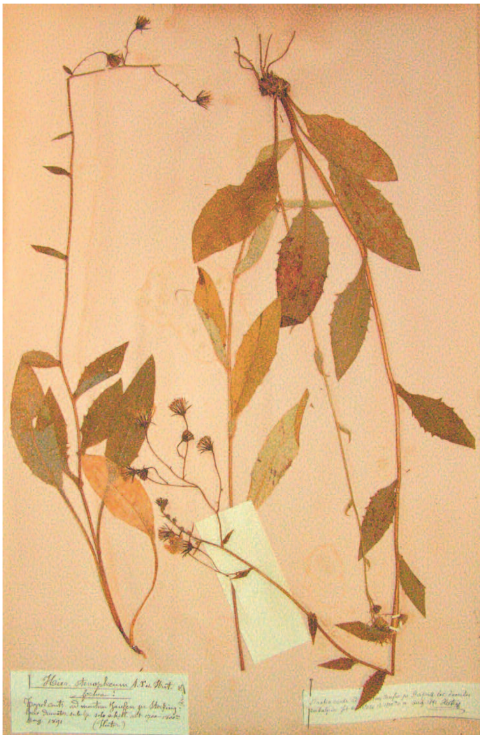
Abb. 3: Hieracium stenoplecum : von Arvet-Touvet determinierter Beleg (GRM)