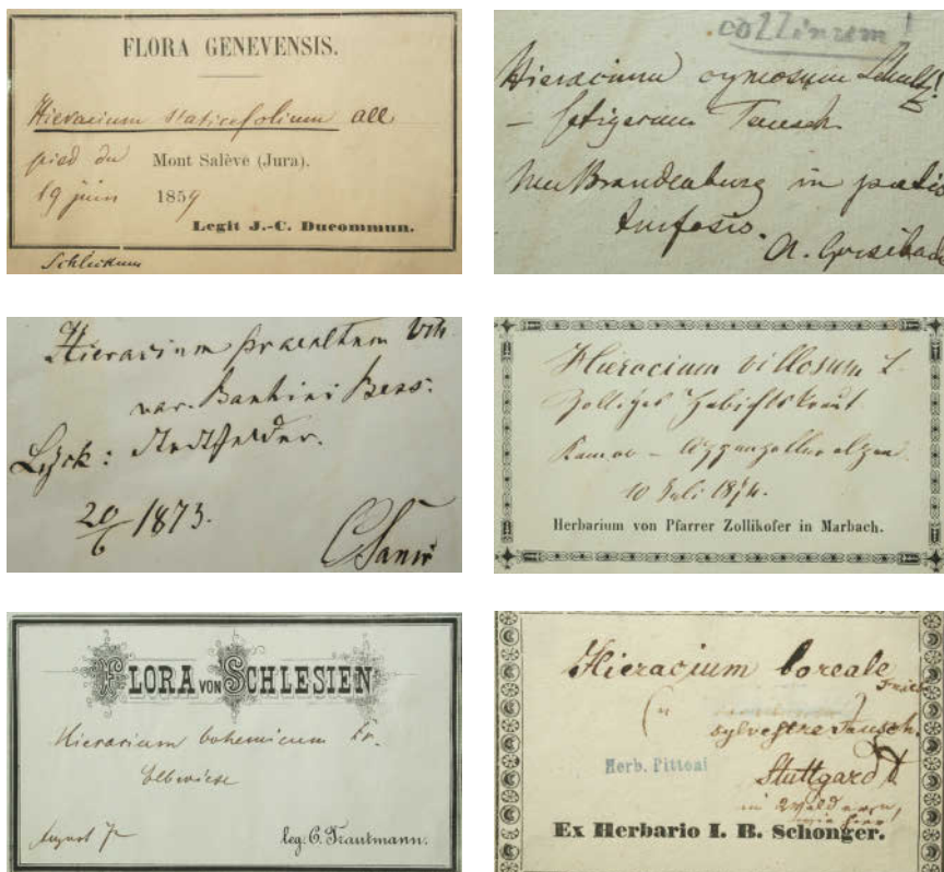
Abbildung 2: Ausgewählte Herbartiketten.