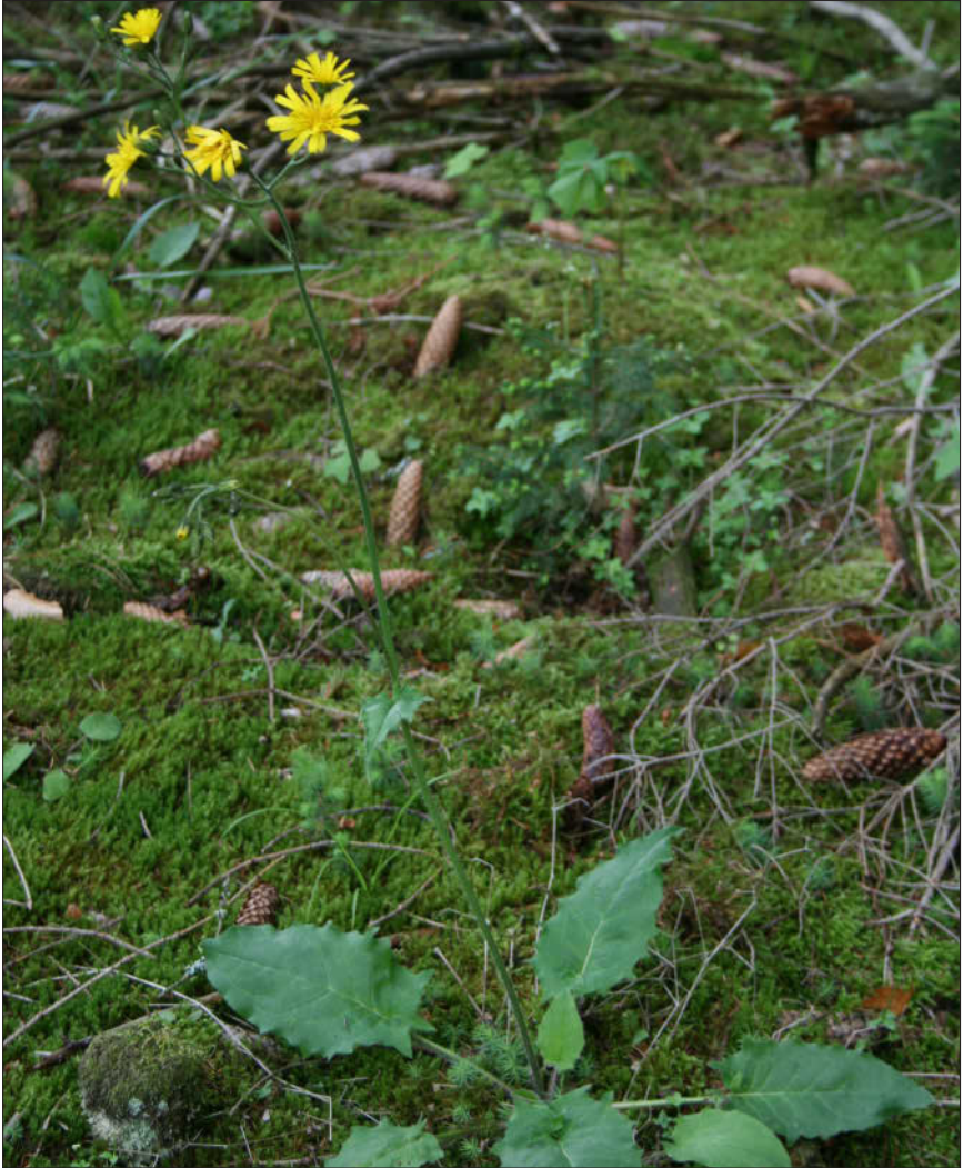
Abbildung 1: Hieracium murorum L., Typus-Art der Gattung; Foto: G. Gottschlich. Figure 1: Hieracium murorum L., species type of the genus; photo: G. Gottschlich.

Mit ca. 1.000 Arten und an die 10.000 Unterarten gehört die Gattung Hieracium L. (Habichtskraut, Asteraceae) zu einer der Großgattungen der Blütenpflanzen (Abb. 1).