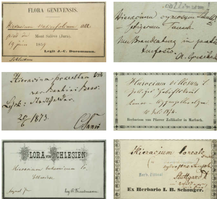
Abbildung 2: Ausgewählte Herbartiketten.