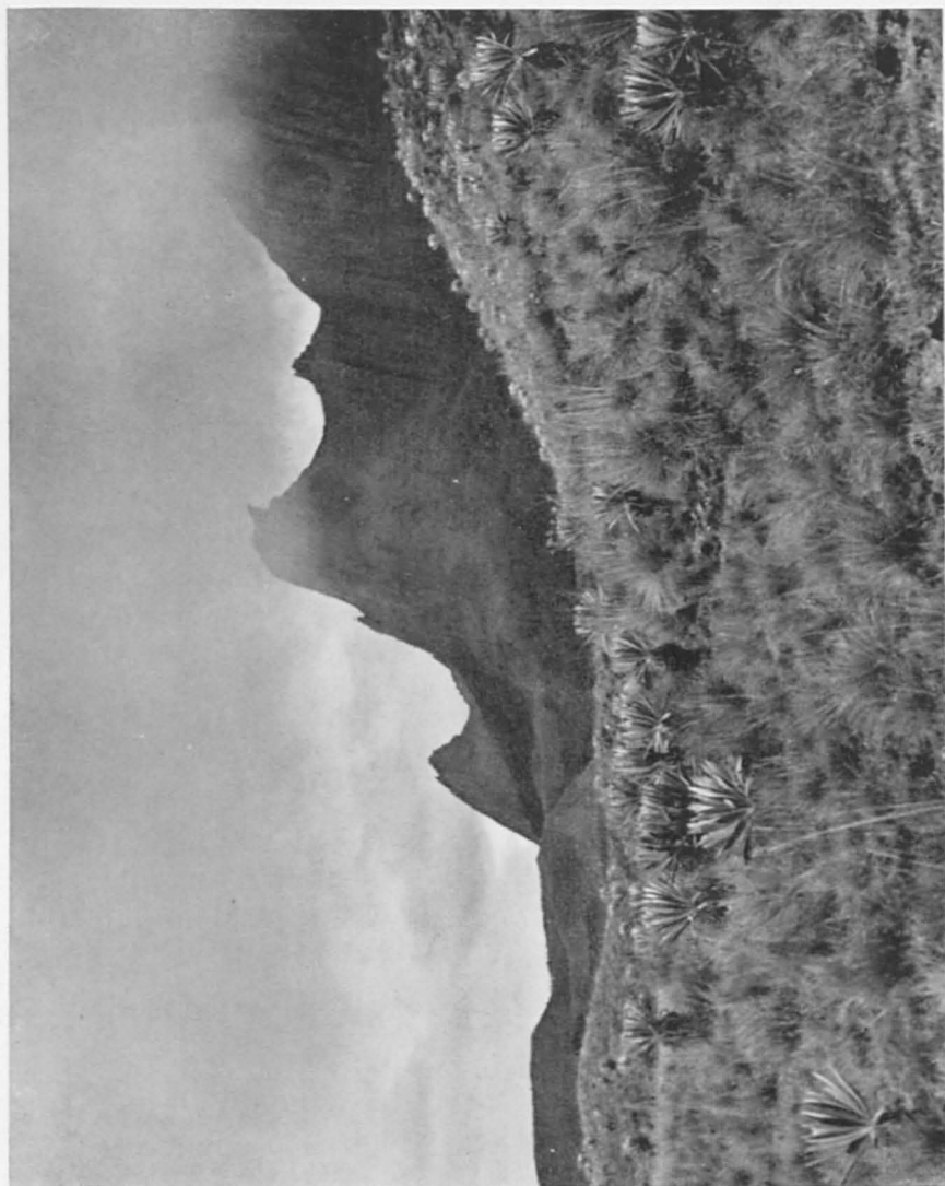
Abb. 1. Paramo der kolumbianischen Ostkordillere Paramo de Bocagrande).