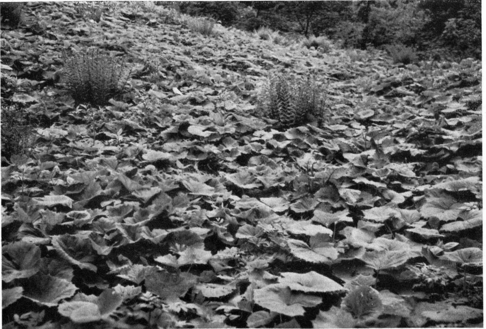
Bild 1: Tozzia-Landschaft: Larwinenschuttflur im Traufbachtal (Allgäu)