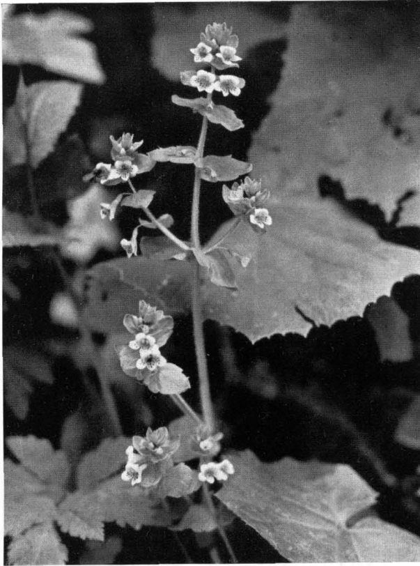
Bild 3: Blütiengipfel der Alpen- Rachenblume (Tozzia alpina). Fliegenbesuch! \frac{2}{3} nat. GröÙe