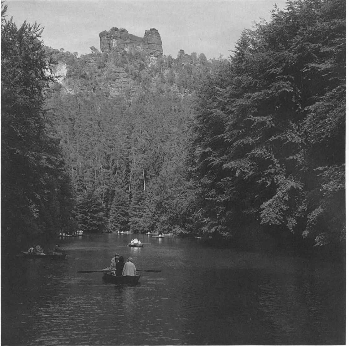
Foto 3: Amselsee bei Rathen (Sächs. Schweiz) mit Felsmassiv „Lokomotive“