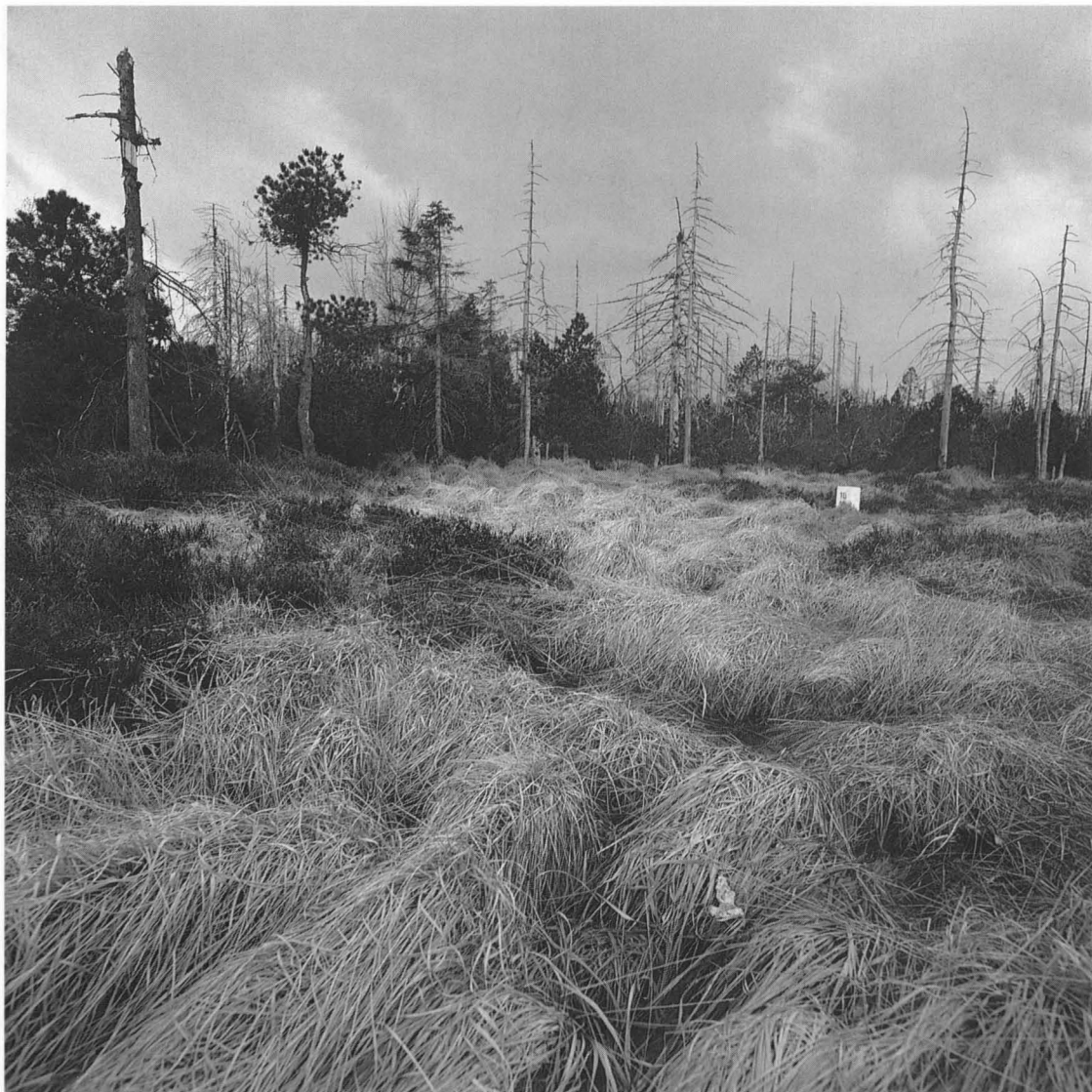
Foto 7: Hochmoor Zinnwald (Erzgebirge) Grenze zwischen Deutschland und ČR