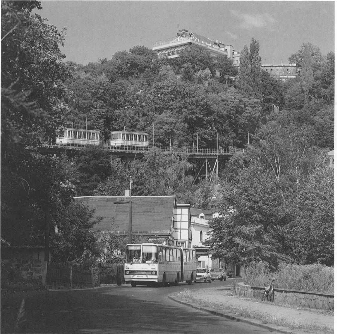
Foto 1: Gaststätte „Luisenhof“ Dresden – Weißer Hirsch – Blick von der Grundstraße mit Standseilbahn