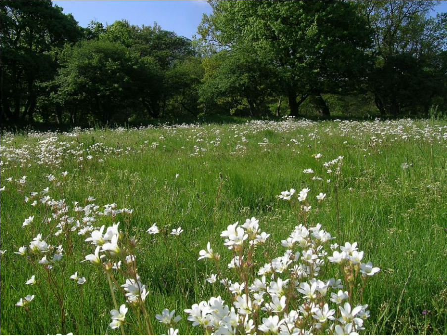
Abb. 22: Massenbestände des Knöllchen-Steinbrechs ( Saxifraga granulata ) auf dem extensiv beweideten Strandwall von Lindhöft