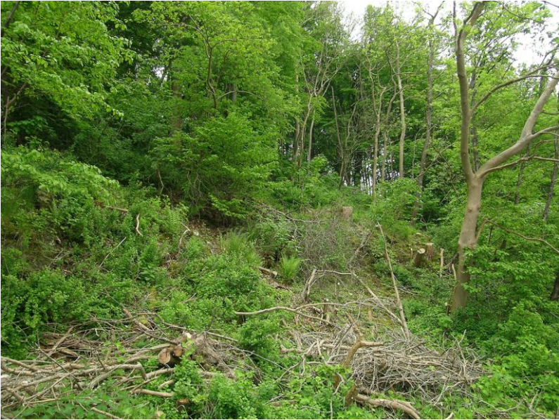
Abb. 14: Einschlag im Ahorn-Eschen-Hangwald (prioritär geschützt nach FFH-RL) von Kiekkut/Grüner Jäger. Die Eutrophierung und Verlichtung der wertvollen Lebensräume ist die Folge.