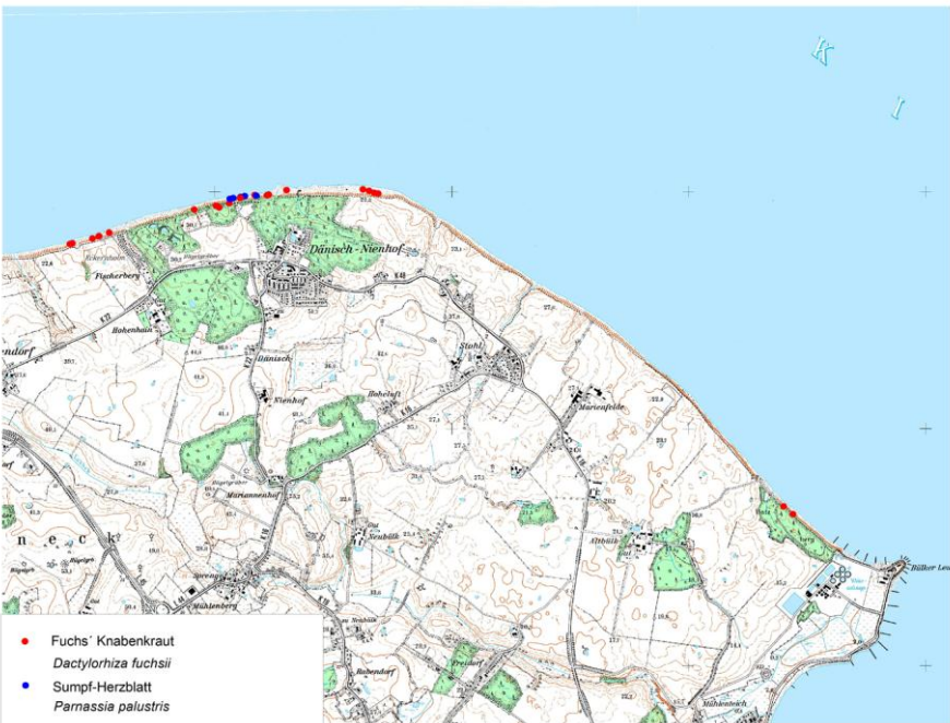
Karte 2: Funde von Dactylorhiza fuchsii und Parnassia palustris an der Eckernförder Bucht 2015

An quelligen und sickerfeuchten Stellen wachsen regelmäßig die Gliederbinse ( Juncus articulatus ), das Zottige Weidenröschen ( Epilobium hirsutum ), junge Weiden-Pflanzen ( Salix spec. , zum Beispiel Salix caprea ) und in den unteren Bereichen das Schilf ( Phragmites australis ) und als Brackwasserzeiger die Sumpfgänsedistel ( Sonchus palustris ). Wo kalkhaltiges Wasser austritt, sind stellenweise Kalktuffquellen ausgebildet. Kennzeichnende Gefäßpflanzenart an solchen offenen Mergelstellen ist die Blaugrüne Segge ( Carex flacca ). Besonders typisch ausgeprägt ist dieser Lebensraumtyp an der Steilküste von Dänisch-Nienhof. Als besondere Schätze der Flora finden sich hier ein großes Vorkommen von Sumpfherzblatt ( Parnassia palustris , Karte 2) mit mehreren tausend Exemplaren sowie Vorkommen von Purgier-Lein ( Linum catharticum ) und Fuchs Knabenkraut ( Dactylorhiza fuchsii , Karte 2).