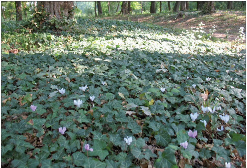
Abb. 21: Cyclamen hederifolium zwischen Hedera helix. Park Zöschen, 27.08.2019