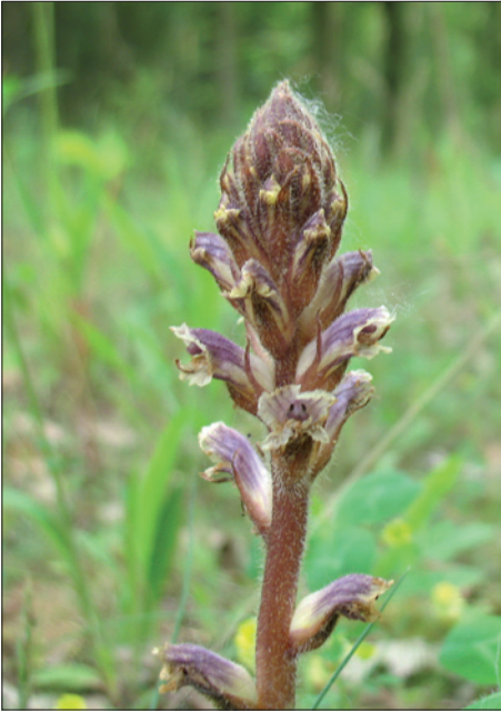
Abb. 29: Orobanche minor auf Trifolium repens -Ansaat. Zwischen Höhennölsen und Theißen, 11.06.2016

wird über die Bastardfreudigkeit einiger Primelgruppen geschrieben: „Bastarde sind innerhalb der Untergattungen Vernales und Auricula zahlreich ... Wo zwei Arten nebeneinander wachsen, wird man in der Mehrzahl der Fälle auch ihre Bastarde finden können... In der Mehrzahl sind die Hybriden unfruchtbar, können aber trotzdem in verschiedenen Formen auftreten... Mehrere Arten bilden fruchtbare Bastarde, die dann durch Aufspaltung und Rückkreuzung einen großen Formenreichtum erzeugen und gewöhnlich alle Übergangsformen von der einen Art zur anderen enthalten (gleitende Reihen).“