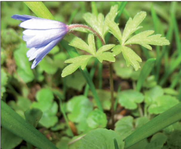
Abb. 19: Anemone blanda. Neuer Friedhof in Eisleben, 02.05.2013

4638-234 Park in Zöschen, vorwiegend in einer weißblühenden Form zwischen Hedera helix . Die Blüten erscheinen noch vor den Blättern. Blüht von August bis