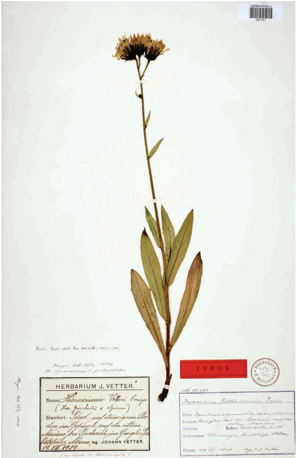
Abb. 3: Typusbeleg von Hieracium vetteri , Herbarium LI.

Kiehl, Zool.-Bot. Ges. ad. LXX. (1920): 196