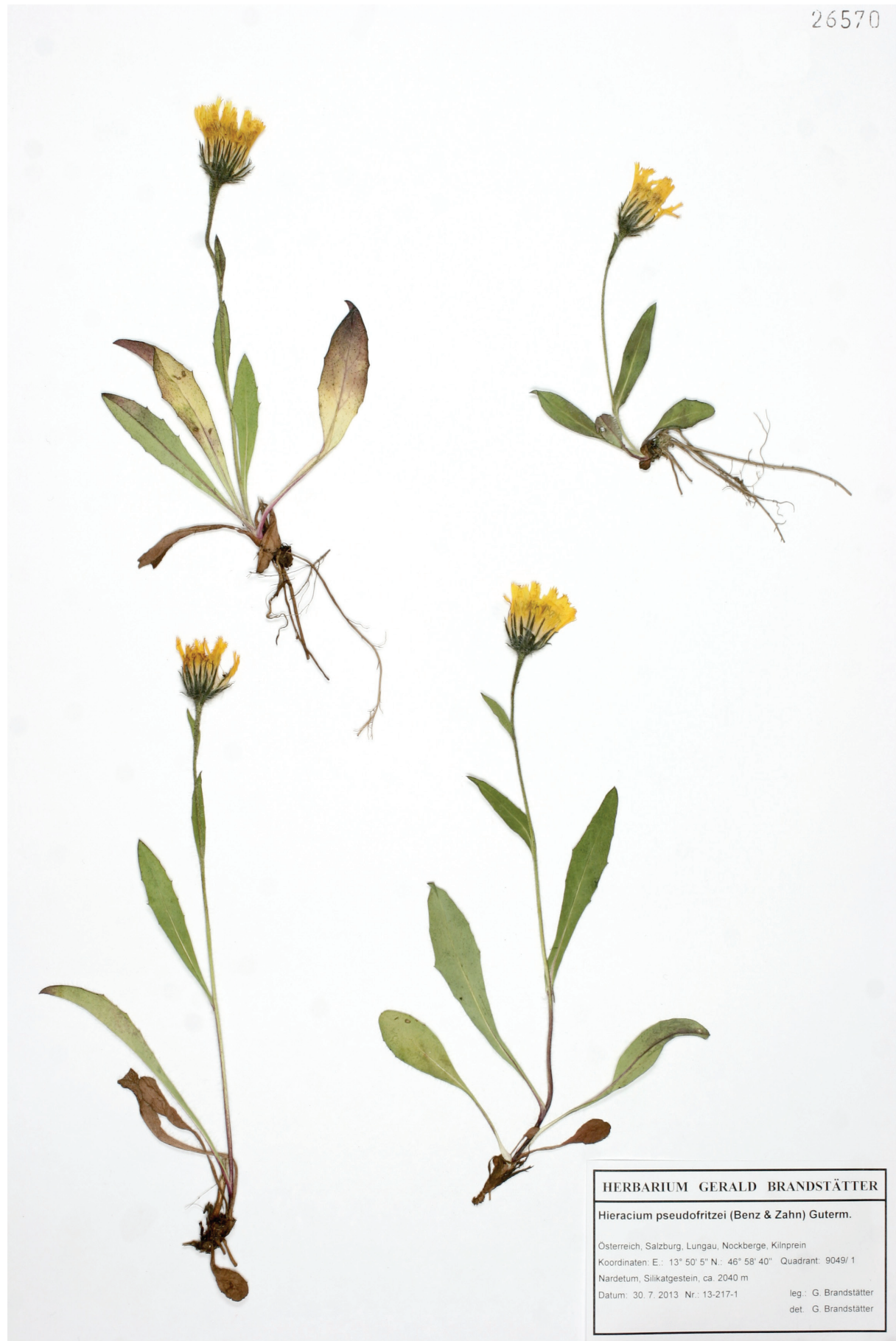
Abb. 2: Hieracium pseudofritzei (Benz & Zahn) Guterm., Habitus, Herbarium G. Brandstätter