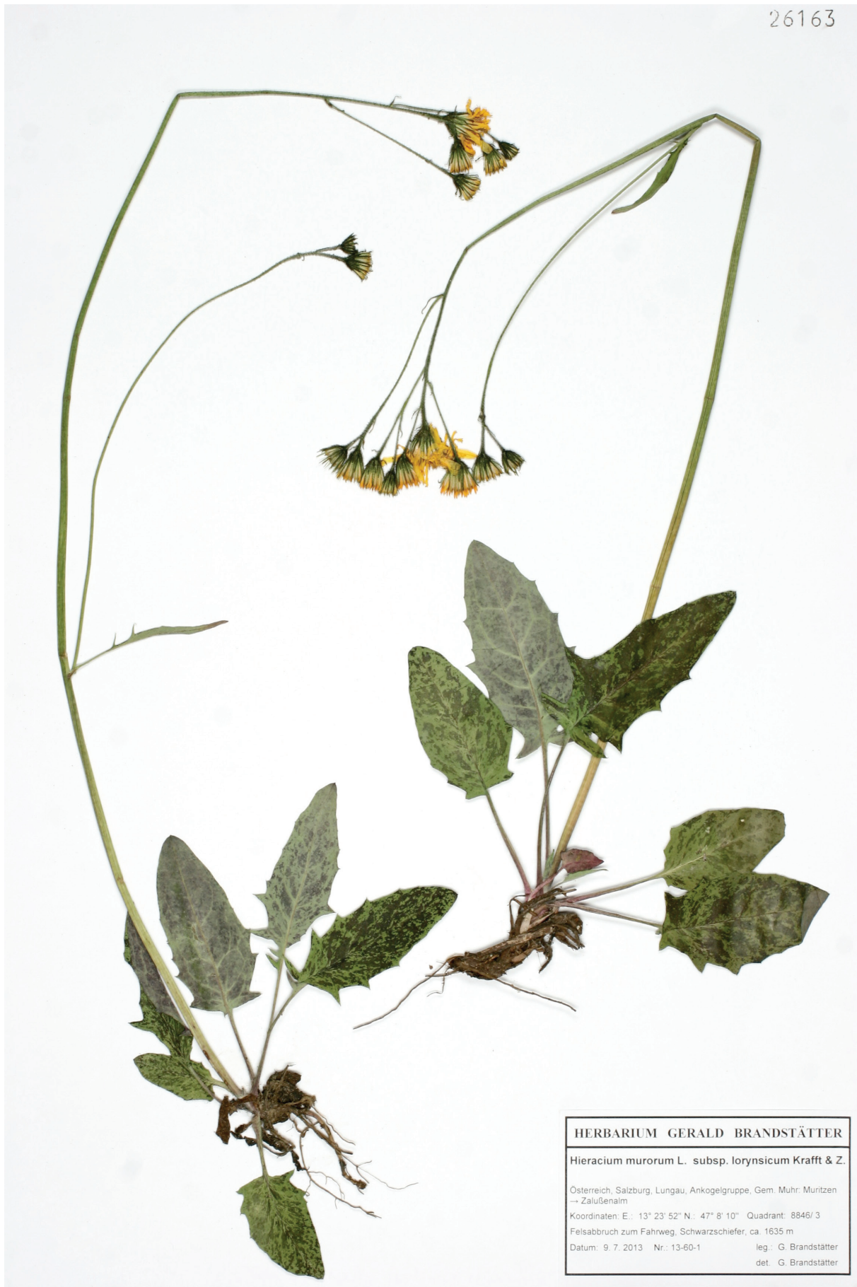
Abb. 1: Hieracium murorum subsp. lorynsicum KRAFFT & ZAHN, Habitus, Herbarium G. Brandstätter