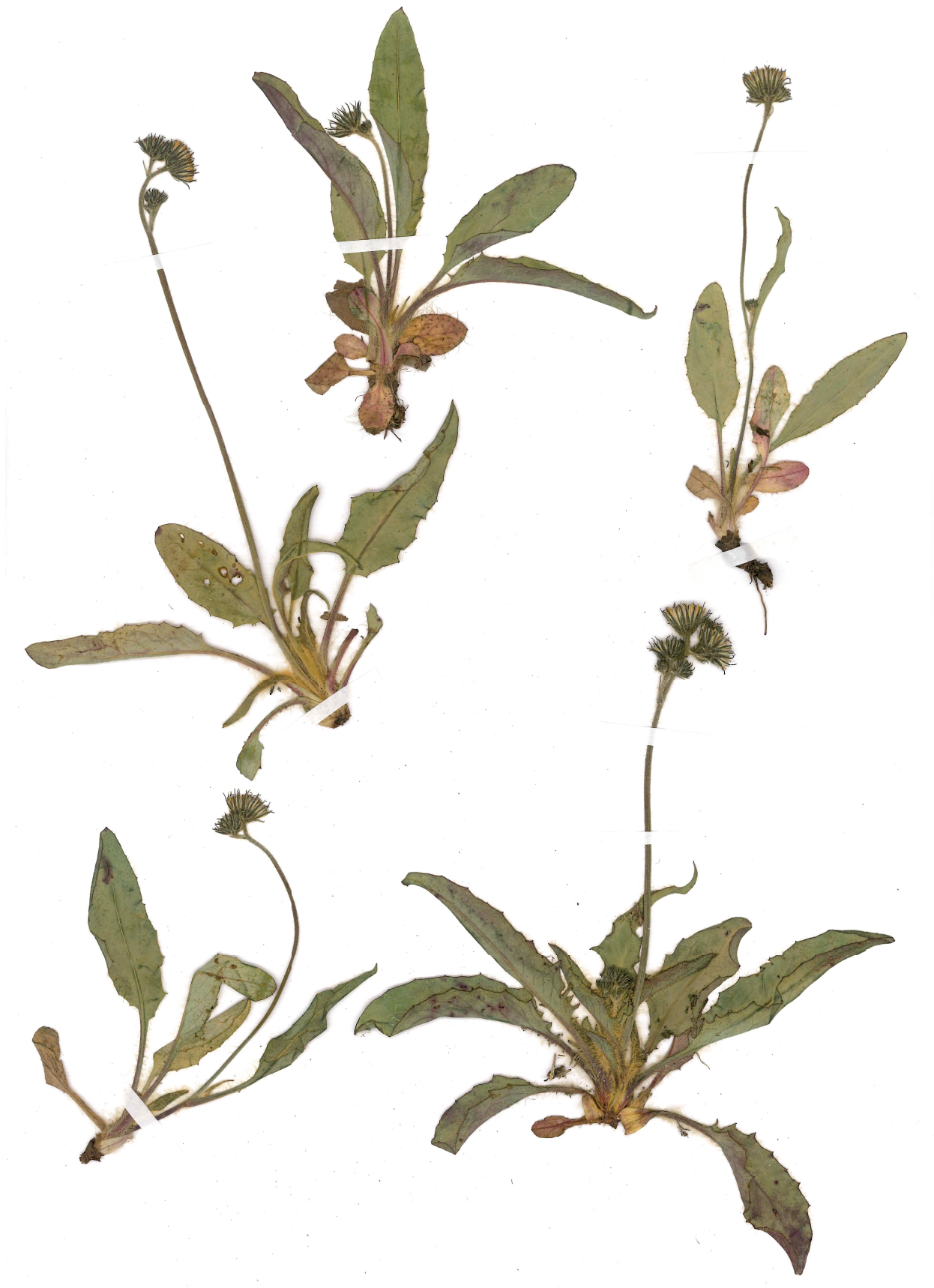
Fig. 15: Hieracium schmidtii subsp. marchettii (Habitus).