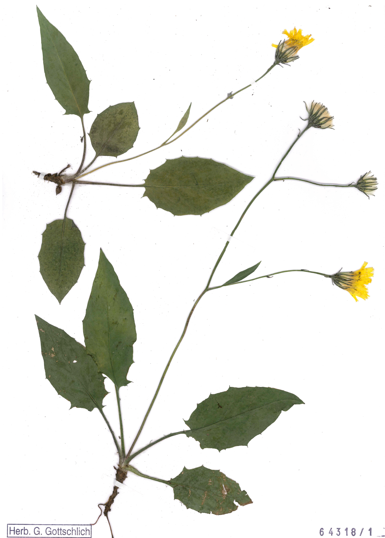
Fig. 7: Hieracium squarrososofurcatum (Habitus).