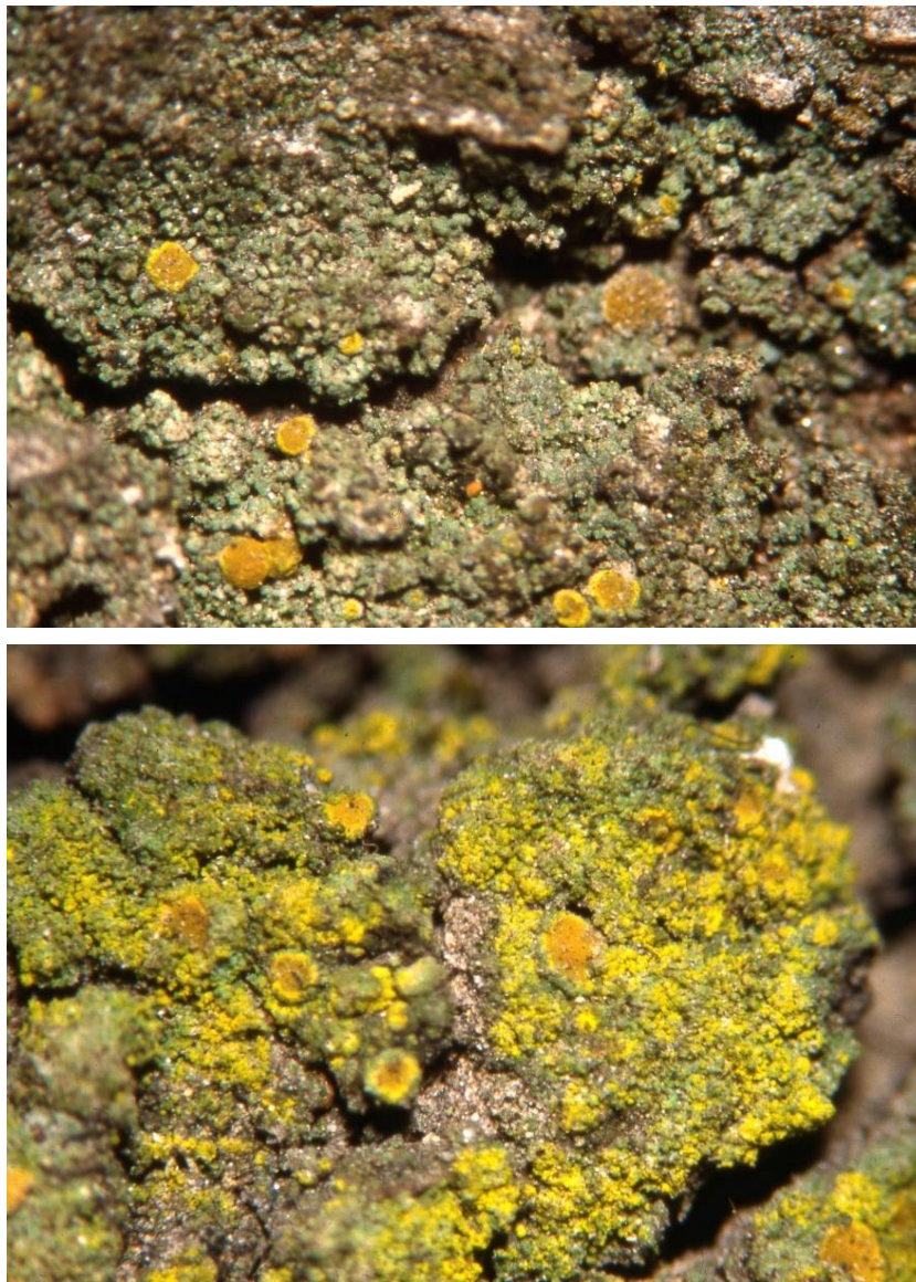
Fig. 3: Candelariella viae-lacteae oben: graue Thallusform (meist in stärker belasteten Gebieten), unten: überwiegend gelbe Thallusform (in weniger stark belasteten Regionen).

Candelariella viae-lacteae wurde 1990 auf der Basis von zwei Funden in Griechenland und einem in Ungarn beschrieben (Thor & Wirth 1990). Danach ist der Thallus rein grau (Fig. 3, oben), körnig bis koralloid oder angedeutet schuppig, mit Körnern um 0,07–0,2 mm. Die Apothecien sind gelb und berandet, mit 8 Sporen im Ascus. Die Flechte wächst epiphytisch auf Koniferen und Laubbäumen, vergesellschaftet mit nitrophytischen Flechten. Beobachtungen in Izmir, Türkei, zeigen, dass in weniger stark belasteten Regionen die Farbe des Thallus auch gelb werden kann. Solche gelben Thalli (Fig. 3, unten) konnten auch im Südwesten Deutschlands beobachtet werden (John 2006: 58). Die bisherigen Beobachtungen stammen meist aus wärmebegünstigten Regionen. Da die Art als recht toxtolerant gilt, wird ihre Ausbreitung wohl weniger durch den SO 2 -Rückgang als vielmehr durch den Klimawandel begünstigt.