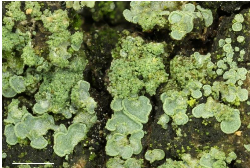
Fig. 4: Normandina pulchella auf Eichenrinde, Maßstab = 1 mm.

Nach Printzen et al. (2022) handelt es sich bei L. macrospora um einen flechtenähnlichen, aber nicht lichenisierten Pilz. Die unauffällige, jedoch aufgrund der langen, dünnen und oftmals gebogenen Sporen recht leicht kenntliche Art wächst offenbar stets mit Trentepohlia umbrina assoziiert in Borkenrissen von Eichen (vgl. Abbildung Voglmayr et al. 2019: 246). Nach Ekman et al. (2013) und Voglmayr et al. (2019) könnte L. macrospora mit einigen nicht näher verwandten lichenisierten oder nicht lichenisierten Pilzen, welche ebenfalls farblose, mehrzellige, schmale Ascosporen besitzen, verwechselt werden. Insbesondere die ebenfalls auf Eiche vorkommende Rhaphidicyrtis trichosporella sieht L. macrospora ähnlich. Rhaphidicyrtis unterscheidet sich jedoch unter anderem durch die Blaufärbung des Hamathecium-Gels nach Zugabe von Jodlösung (Lugol) und Vorbehandlung mit 10%iger Kalilauge (Aguirre-Hudson 1991, Ekman et al. 2013, Voglmayr et al. 2019). Leptosillia macrospora dürfte weit verbreitet und nicht gefährdet sein. Zahlreiche neuere Funde wurden aus dem angrenzenden Ostthüringen gemeldet (Rettig 2019). In der aktuellen Roten Liste der Flechten Thüringens (Eckstein & Grünberg 2021) ist sie nicht enthalten. Dies trifft ebenfalls für das angrenzende Bundesland Sachsen-Anhalt zu (Stordeur & Kison 2016, 2020). Wirth et al. (2011) machen in der Roten Liste der Flechten Deutschlands auf die unzureichende Datenlage zur Abschätzung der Verbreitung aufmerksam.