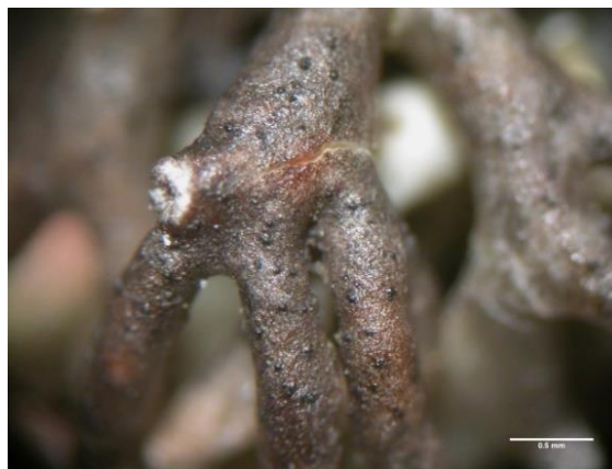
Fig. 7: Perithezien von Sphaerellothecium minutum auf Thallusabschnitten von Sphaerophorus fragilis .

(N, WD) * Sphaerellothecium minutum Hafellner