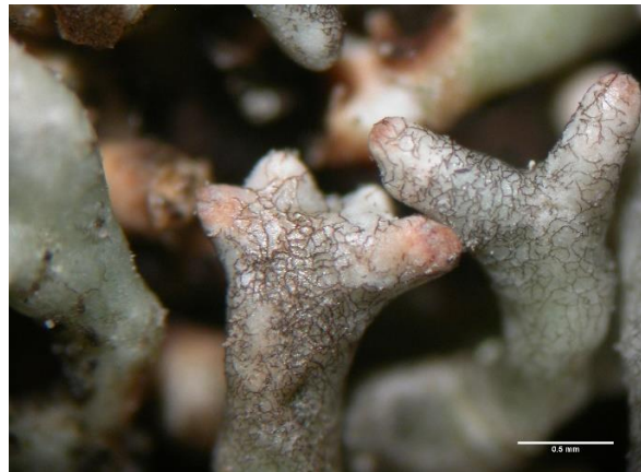
Fig. 6: Hyphennetz von Sphaerellothecium minutum auf Thallusabschnitten von Sphaerophorus fragilis .