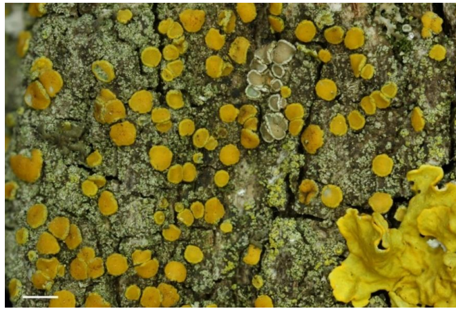
Fig. 5: Scythioria phlogina auf Borke von Weide, Maßstab = 1 mm.