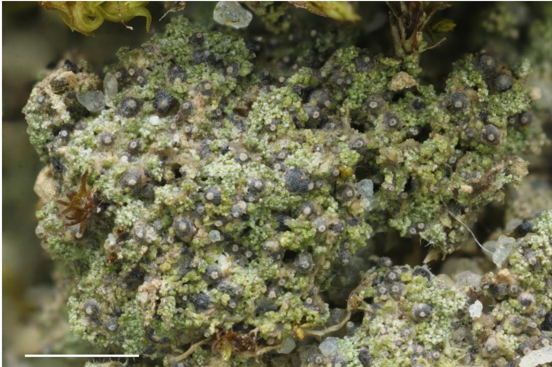
Fig. 8: Verrucaria bryoctona auf sandiger Erde, Maßstab = 1 mm.

Die ephemere Flechte kann man nur bei ausreichend feuchter Witterung vor allem im Winterhalbjahr finden. Sie wächst auf basenreichen Sand- und Lehmböden oder über Erdmoosen an offenen Standorten. Der graugrüne Thallus ist aus goniocystenartigen Strukturen aufgebaut, und die dunkelgrauen bis schwarzen Perithezien sind mehr oder weniger ins Substrat eingesenkt (Fig. 8).