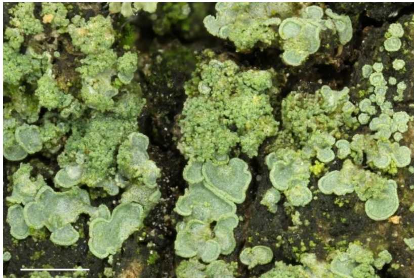
Fig. 4: Normandina pulchella auf Eichenrinde, Maßstab = 1 mm.

Nach Printzen et al. (2022) handelt es sich bei L. macrospora um einen flechtenähnlichen, aber nicht lichenisierten Pilz. Die unauffällige, jedoch aufgrund der langen, dünnen und oftmals gebogenen Sporen recht leicht kenntliche Art wächst offenbar stets mit Trentepohlia umbrina assoziiert in Borkenrissen von Eichen (vgl. Abbildung Voglmayr et al. 2019: 246). Nach Ekman et al. (2013) und Voglmayr et al. (2019) könnte L. macrospora mit einigen nicht näher verwandten lichenisierten oder nicht lichenisierten Pilzen, welche ebenfalls farblose, mehrzellige, schmale Ascosporen besitzen, verwechselt werden. Insbesondere die ebenfalls auf Eiche vorkommende Rhaphidicyrtis trichosporella sieht L. macrospora ähnlich. Rhaphidicyrtis unterscheidet sich jedoch unter anderem durch die Blaufärbung des Hamathecium-Gels nach Zugabe von Jodlösung (Lugol) und Vorbehandlung mit 10%iger Kalilauge (Aguirre-Hudson 1991, Ekman et al. 2013, Voglmayr et al. 2019). Leptosillia macrospora dürfte weit verbreitet und nicht gefährdet sein. Zahlreiche neuere Funde wurden aus dem angrenzenden Ostthüringen gemeldet (Rettig 2019). In der aktuellen Roten Liste der Flechten Thüringens (Eckstein & Grünberg 2021) ist sie nicht enthalten. Dies trifft ebenfalls für das angrenzende Bundesland Sachsen-Anhalt zu (Stordeur & Kison 2016, 2020). Wirth et al. (2011) machen in der Roten Liste der Flechten Deutschlands auf die unzureichende Datenlage zur Abschätzung der Verbreitung aufmerksam.