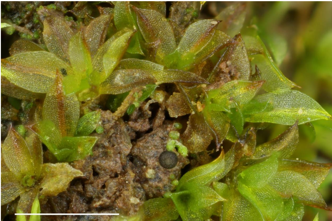
Fig. 1: Ein Perithecium von Agonimia vouauxii zwischen Moospflanzen von Leptohascum leptophyllum , Maßstab = 1 mm.

Die kleine, ephemere Krustenflechte wächst auf Erde und bildet ein körniges bis kleinschuppiges Lager. Die kugeligen bis leicht eiförmigen Perithechien sind 0,1–0,2 mm breit, dunkelgrau bis schwarz mit einer etwas helleren Ostiolarregion und sitzen dem Thallus auf oder sind leicht eingesenkt (Fig. 1). Die Art bevorzugt offene Standorte und mehr oder weniger basische Verhältnisse. Der erste Nachweis von A. vouauxii für Deutschland wurde von Rätzel et al. (2003) für Brandenburg publiziert. Seitdem wurde die Art in mehreren weiteren Bundesländern nachgewiesen (vgl. Wirth et al. 2013), u. a. im Nachbarland Thüringen (Grünberg et al. 2017).