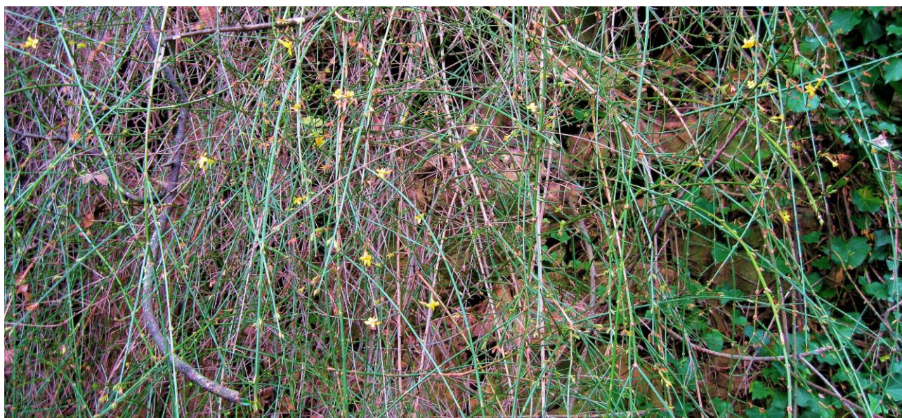
Abb. 12: Jasminum nudiflorum ; Erstfund für die Insel Krk: Omišalj/Castelmuschio/Moschau: an der Straße von der Altstadt zum Hafen, Böschung vom Wald zur Straße, 28.03.2018

Jasminum nudiflorum LINDL. (Abb. 12) !!Neu für die Insel Krk/Veglia/Vöglis!! ; zerstreut kultiviert und selten verwildert.