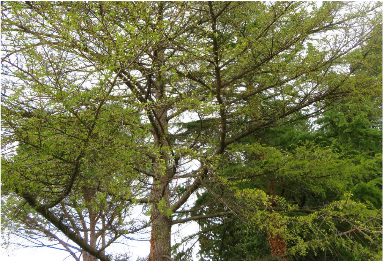
Abb. 2: Larix decidua subsp. decidua ; Erstfund für die Insel Krk (kultiviert).

Larix decidua MILL. subsp. decidua (Abb. 2); sehr selten kultiviert. Erstmals in Kultur beobachtet: SSW Malinska/Malisca/Durischal, Milčetići, N 45°07'13,14", E 14°31'22,84", 8 m alt.; 12.04. 2019.