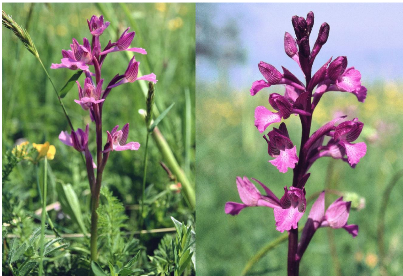
Abb. 13: Anacamptis \times gennarii ( A. morio \times A. papilionacea); Erstfund für die Insel Krk: W Malinska/Malisca/Durischal, Porat/Porto; 23.04.2000