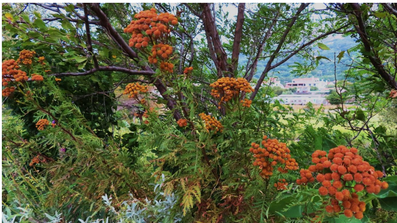
Abb. 7: Tanacetum vulgare ; Erstfund für die Insel Krk; Foto: Walter K. ROTTENSTEINER; det. Walter K. ROTTENSTEINER.

Tanacetum vulgare L. (Abb. 7) !!Neu für die Insel Krk/Veglia/Vögl's!! ; selten. Der Rainfarn wurde auf dieser Insel erstmals am 06.09.2019 entdeckt, NW Baška/Bescanuova/Weschke in Jurandvor/Giurandvor/Vidklau etwa nördlich vom Gasthaus "Malin" an der Uferböschung des Baches Suha Ričina/Fiumera, N 44°58'24,74", E 14°44'09,64", 16 m alt.