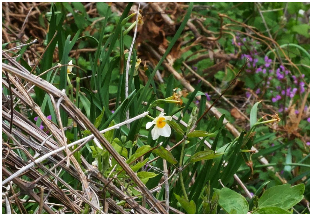
Abb. 5: Narcissus tazetta subsp. italicus ; Erstfund für die Insel Krk; Foto: Jürgen HERBST; confirm. Michael MÜNCH.