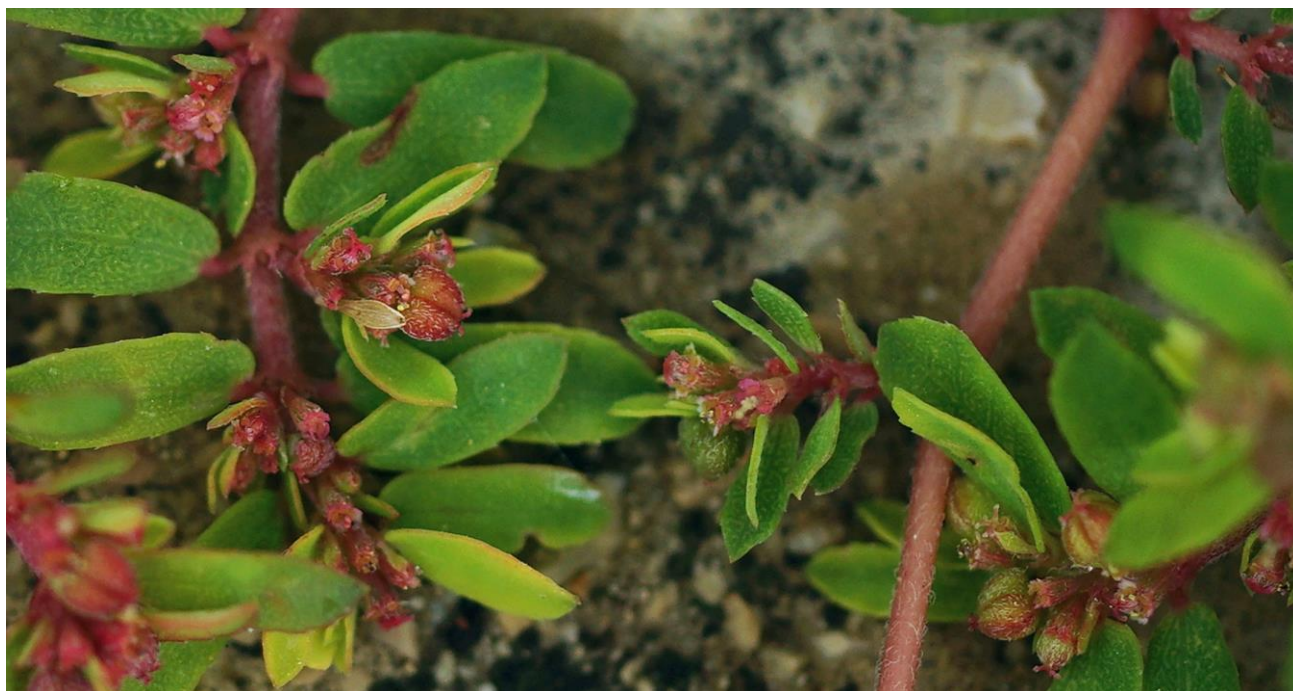
Abb. 10: Euphorbia maculata ; Erstfund für die Insel Krk; det. Božo FRAJMAN.

Euphorbia maculata L. (Abb. 10) !!Neu für die Insel Krk/Veglia/Vögl's!! ; selten. Diese Art konnte erstmals am 03.10.2017 bei Zarok/Cosmo W Baška/Bescanuova/Weschke gefunden werden.