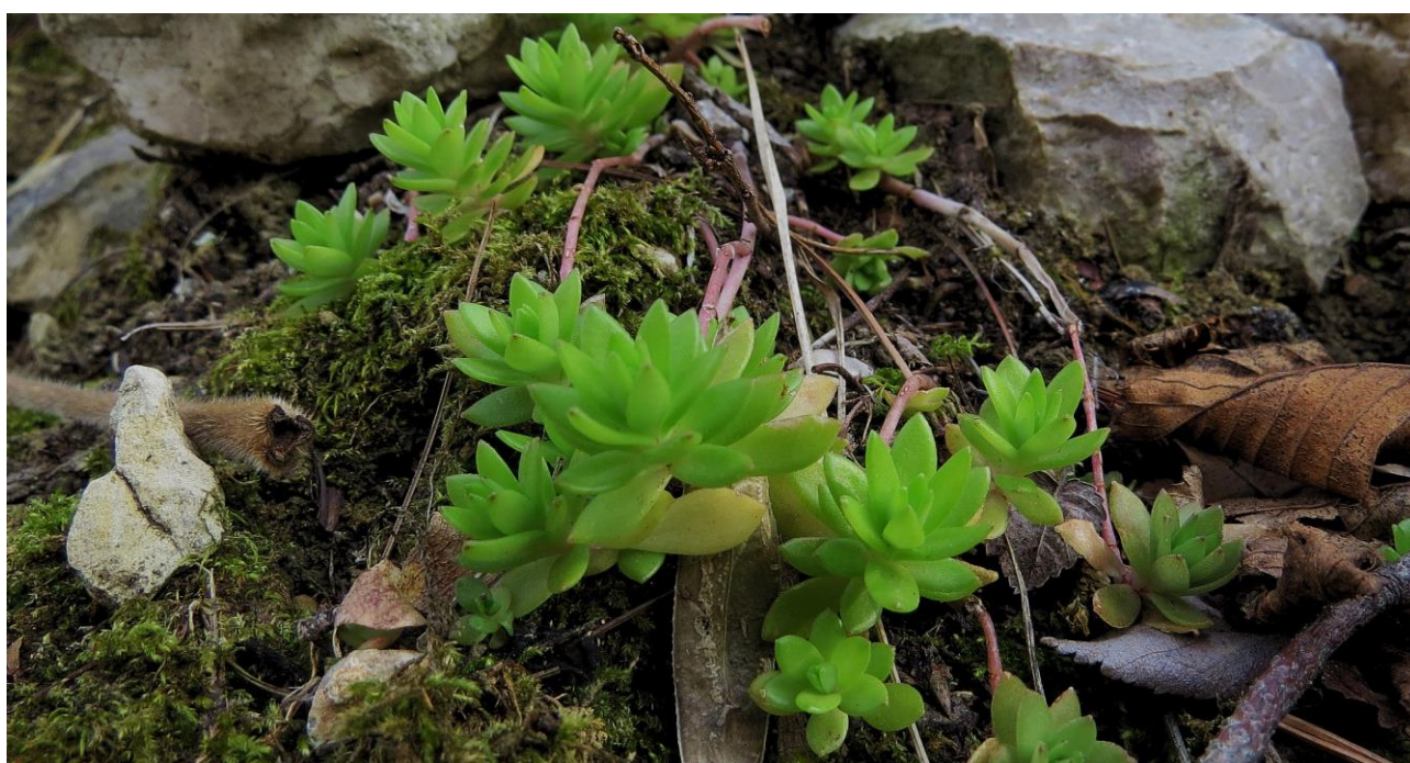
Abb. 9: Sedum sarmentosum ; Erstfund für die Insel Krk; det. Walter K. ROTTENSTEINER.