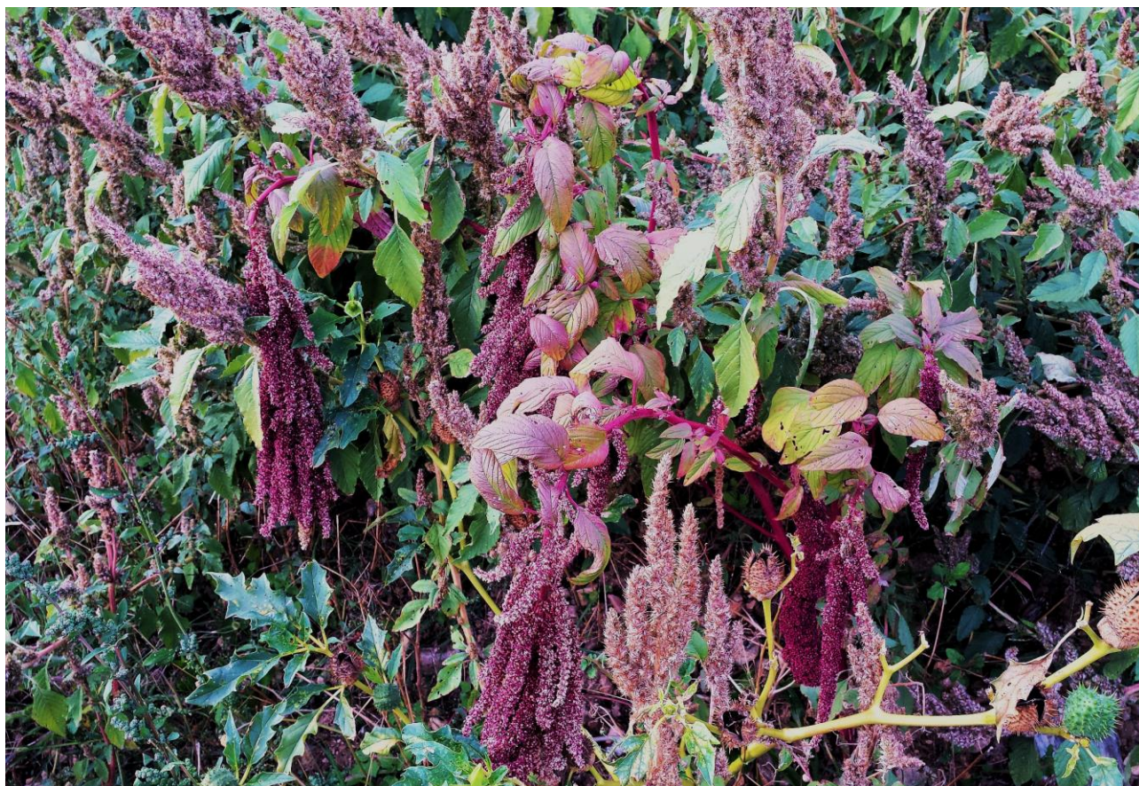
Abb. 4: Amaranthus caudatus ; Erstfund für die Insel Krk; confirm. Johannes WALTER.

Amaranthus caudatus L. (Abb. 4) !!Neu für die Insel Krk/Veglia/Vöglis!! ; selten. Der Wildbestand wurde am 13.10.2019 auf einer Aufschüttung NW Jurandvor/Giurandvor/Vidklau (N 44°59' 01,95", E 14°43'40,92", 45 m alt.) entdeckt und nur fotografiert.