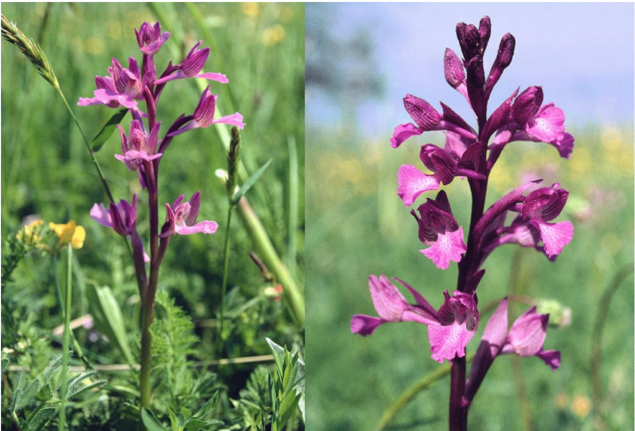
Abb. 13: Anacamptis × gennarii ( A. morio × A. papilionacea); Erstfund für die Insel Krk: W Malinska/Malisca/Durischal, Porat/Porto; 23.04.2000