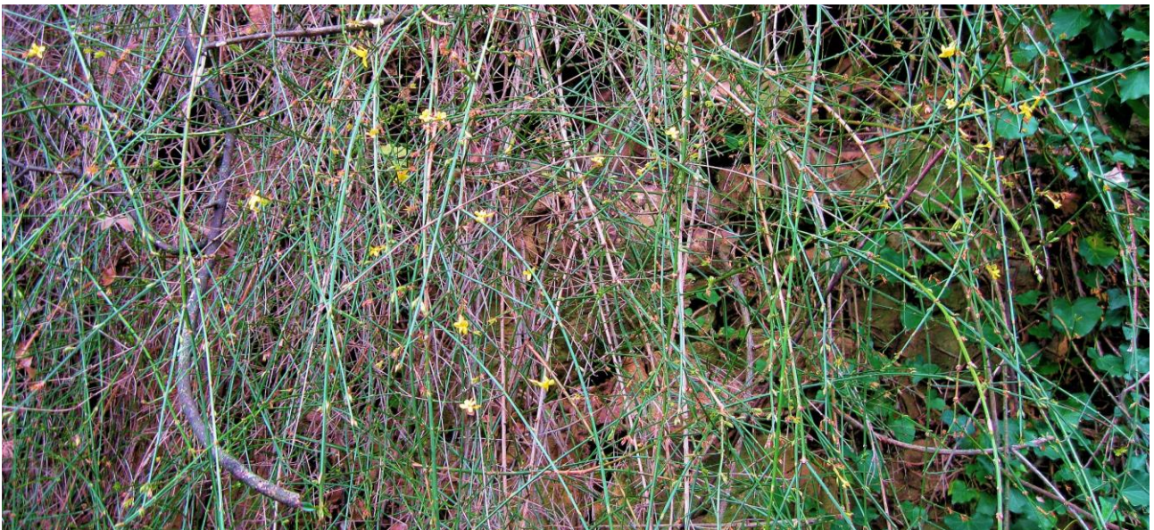
Abb. 12: Jasminum nudiflorum ; Erstfund für die Insel Krk: Omišalj/Castelmuschio/Moschau: an der Straße von der Altstadt zum Hafen, Böschung vom Wald zur Straße, 28.03.2018

Jasminum nudiflorum LINDL. (Abb. 12) !!Neu für die Insel Krk/Veglia/Vögl's!! ; zerstreut kultiviert und selten verwildert.