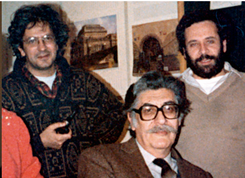
Ο Λεωνίδας Λουλιούδης με τους ποιητές Μανώλη Αναγνωστάκη και Γιώργο Μαρκόπουλο, 1987 (αρχείο Γ. Ζεβελάκη)

Τριπτόλημο, την περιοδική έκδοση του Γεωπονικού Πανεπιστημίου.