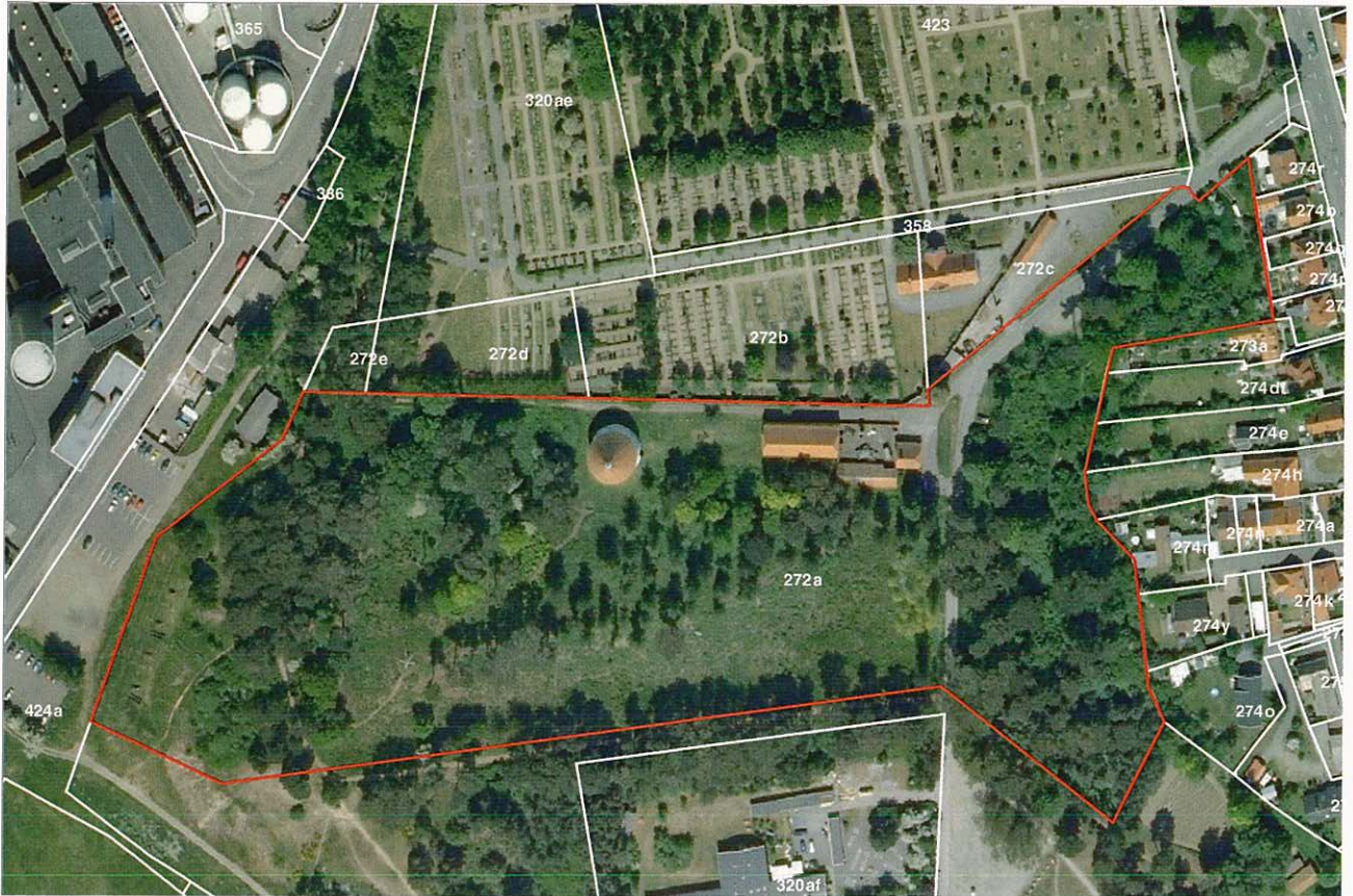
Kortbilag fra fredningsforslaget