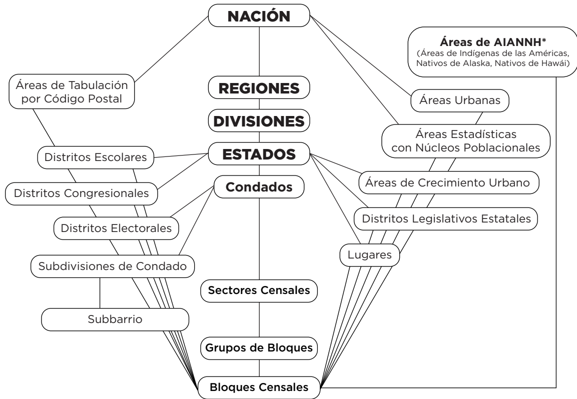
Figura 2-1. Jerarquía Estándar de las Entidades Geográficas del Censo

* Consulte "Jerarquía de las Áreas de Indígenas de las Américas, Nativos de Alaska y Nativos de Hawái".