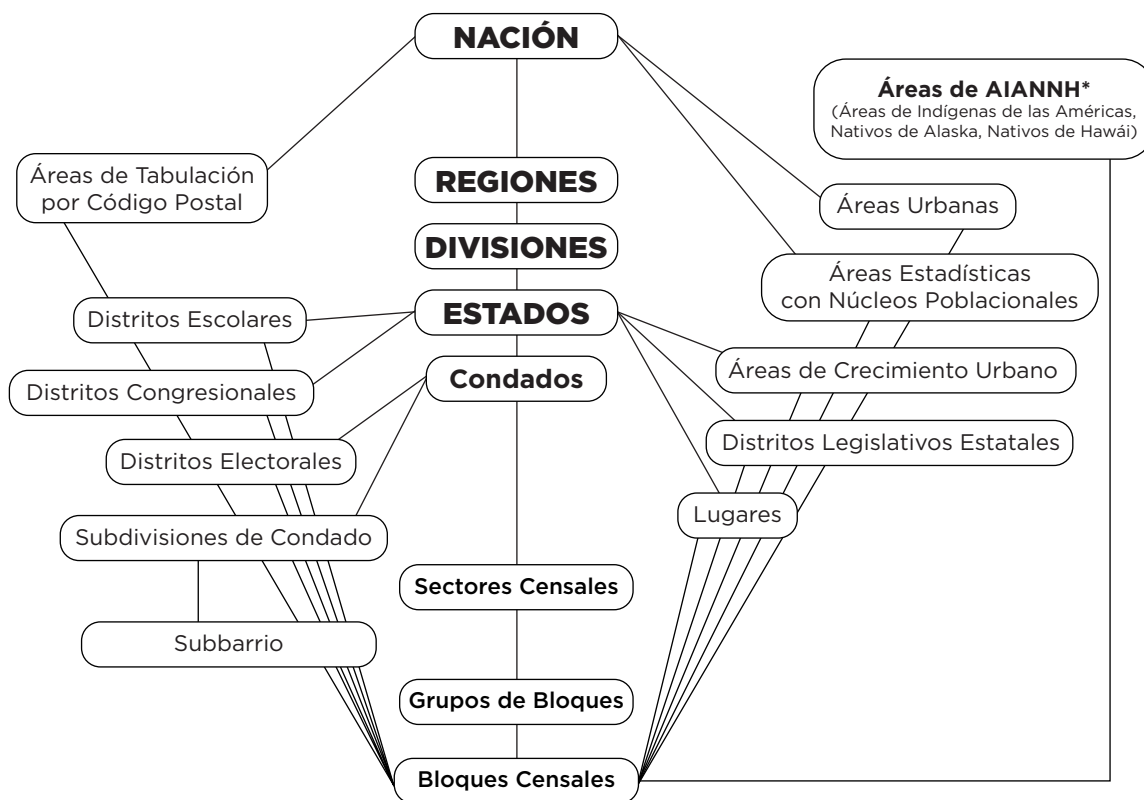
Figura A-1. Jerarquía Estándar de las Entidades Geográficas del Censo

La Figura A-1, que es un diagrama de la jerarquía geográfica, presenta esta información como una serie de relaciones anidadas. Por ejemplo, una línea que une la entidad del nivel inferior Lugar y la entidad de nivel superior Estado significa que un lugar no puede cruzar un límite estatal; una línea que une Sector Censal y Condado significa que un sector censal no puede cruzar un límite de condado, y así sucesivamente. No hay una jerarquía implícita entre distintas direcciones de las líneas; por ejemplo, un sector censal se encuentra dentro de un condado, pero puede cruzar el límite de una subdivisión de un condado, aunque la subdivisión de condado también se encuentre dentro del Condado.