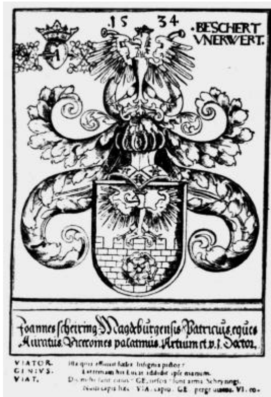
Wappenbild von Lucas Cranach 1534