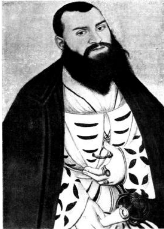
Dr. Johannes Scheiring (1534)